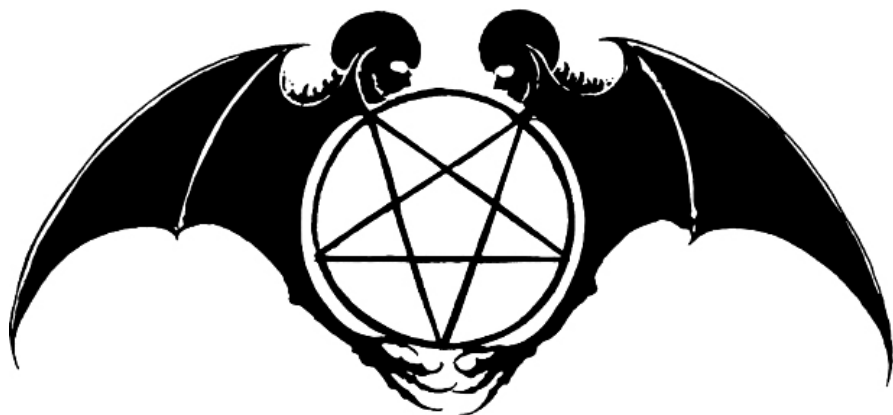
Символ Варколачи Культовые врата Черного Ордена Дракона

Мы пьем из Солнца в полночь, и кровь застывает под бледной луной. Мы пьем из экстаза Клиппот и уходим усиленными и целостными.