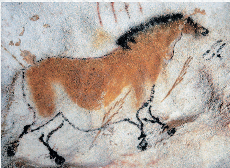
Изображение лошади. Наскальная живопись. Пещера Ласко. Ок. 15 тыс. до н. э.

жения животных и сцен охоты, имевших, по мысли наших предков, магическую силу.