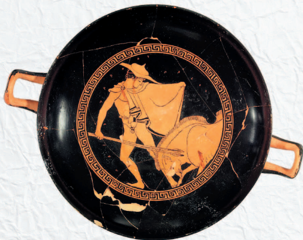
Краснофигурный килик. Греция. 480 г. до н. э.

В дальнейшем пространство между фигурами стали покрывать черным лаком, а очертания фигур имели естественный цвет красной глины. Так появился краснофигурный стиль. Росписи по керамике с белым фоном стали высшим уровнем греческих мастеров. Здесь использовалась разнообразная палитра цветов – белый, желтый, оранжевый, красный, коричневый, зеленый и другие.