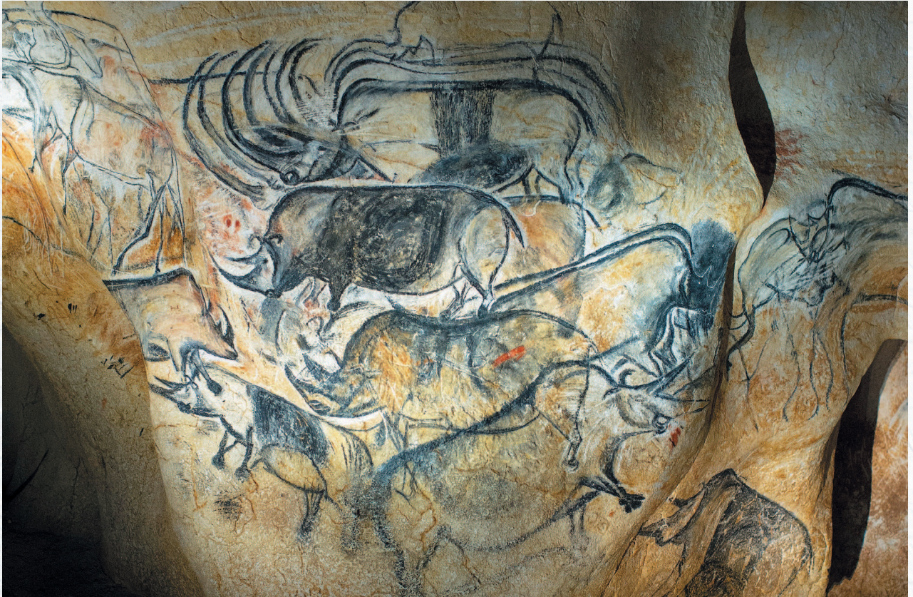
Изображение носорогов. Наскальная живопись. Пещера Шове. Ок. 30 тыс. лет до н. э.

Интересно отметить, что живописные образы, создаваемые первобытными людьми, остава-