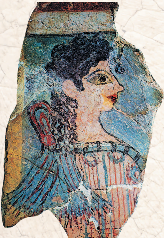
«Парижанка». Ок. XV в. до н. э.

филь, так же как руки и ноги, а верхнюю часть туловища – анфас. В те времена художники не умели еще передавать игру цвета и изображать полутона. Основными цветами были белый, черный, красный, синий, желтый и зеленый. Краски изготавливались из минералов – извести, древесного и каменного угля, железной и медной руды, и долго не теряли своей яркости. Чтобы росписи сохранялись дольше, их покрывали слоем смолы. Живопись в Древнем Египте служила преимущественно для украшения гробниц, храмов, дворцов и зданий, где жили знатные люди. Широкое распространение имели также живописные изображения на папирусе, например многочисленные копии священной «Книги мертвых».