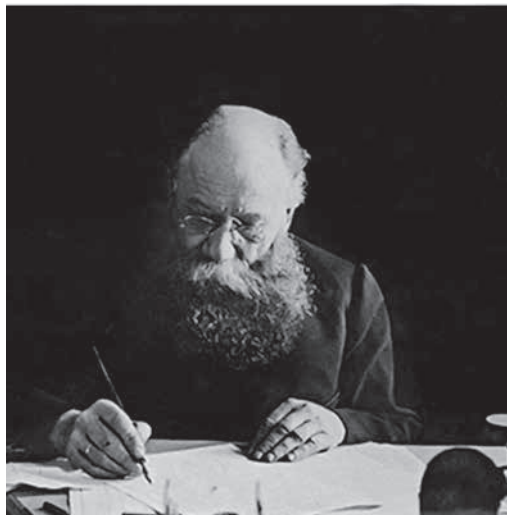
Степан Григорьевич Матвеев (1858–1919)