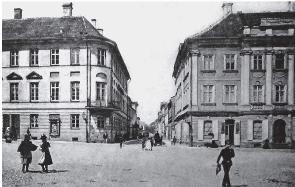
Юрьевский университет на рубеже XIX–XX вв.