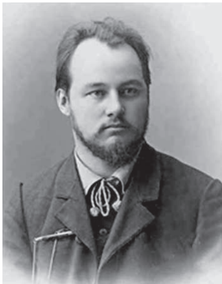
Михаил Константинович (в письмах — Миша) Вентцель (1882–1963)