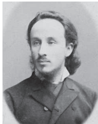
Константин Николаевич Вентцель (1857–1947)

даже и чтобы письмо написать; при этом камера для хранения багажа оказалась так переполнена, что у меня не могли принять вещей на хранение. Тогда я решил отправиться с вещами прямо к дяде Саше. Сел на извозчика и поехал. Но увы! Когда я приехал по записанному у меня адресу, никакого дяди Саши там не оказалось! Потом оказалось, что у меня неверно было записано: нужно Знаменская, д. 6. кв. 5, а у меня, наоборот, д. 5, кв. 6! Кроме того, я потом узнал, что дяди Саши нет сейчас в Питере и что он приедет из Кисловодска только семнадцатого.