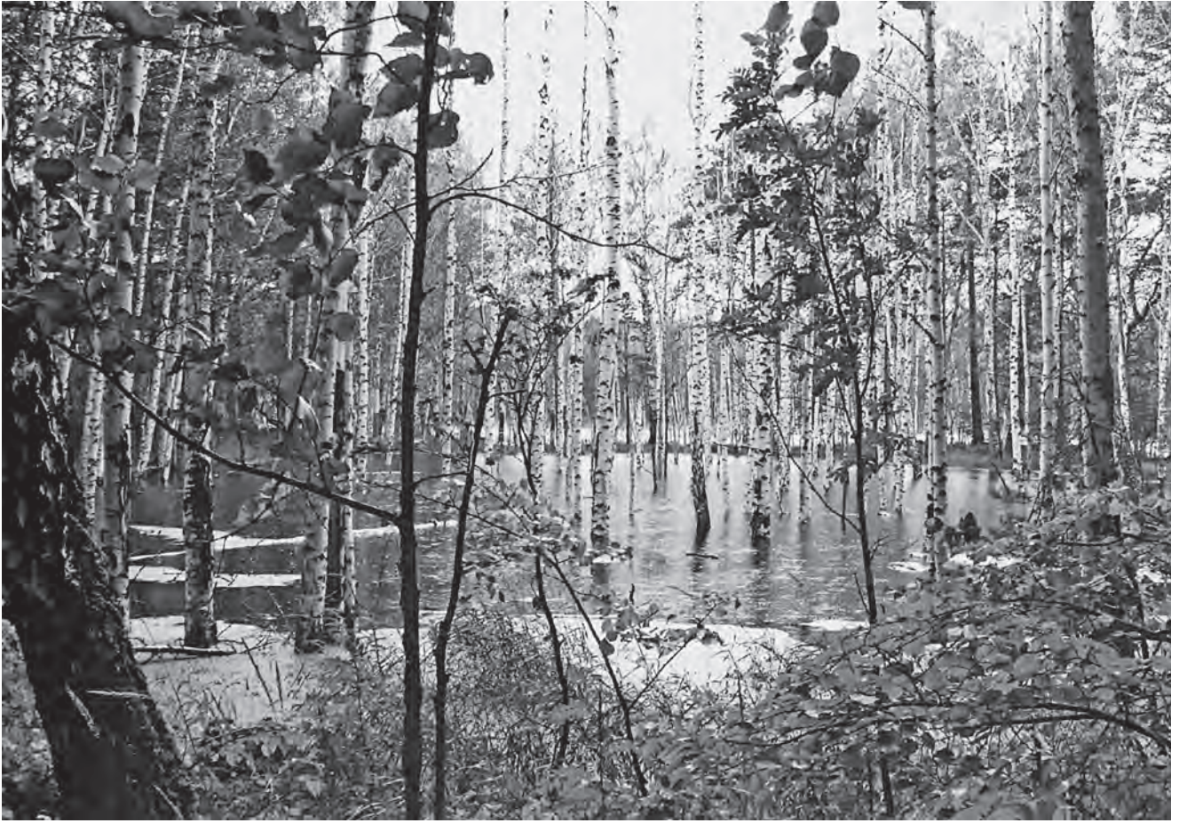
Заболоченный лес на острове Веры

ного центра одноименной области. Миасс остался у меня в памяти как единственный город России, в котором на тот момент не работала система неофициальных такси. Напрасны были мои попытки остановить машину, чтобы добраться до находящегося в 15 км от Миасса и, возможно, возникшего 15 млн лет назад озера Тургойак, которое считается одним из младших братьев величественного озера Байкал. Наконец мне удалось вызвать одно из немногочисленных официальных такси, которые имеются в городе. Озеро Тургойак окружено горами. Пляжи и кристально чистая вода постоянно привлекают сюда состоятельных