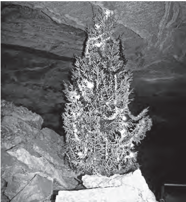
В канун Нового года ученые ставят в Кунгурской пещере елку, наряженную в честь праздника

Меня отвез в Кунгур на своем старом «жигуленке» Володя, безработный врач родом из Норильска. Город с населением 68 000 человек скорее маленький для российских масштабов. Название Кунгур происходит из тюркского