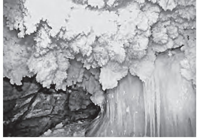
Спускающиеся до пола пещеры ледяные кристаллы, появляющиеся при температуре ниже -30°C

языка и означает «теснина, пещера». Царь Алексей Михайлович (1629–1676) велел основать город как крепость для защиты от воинственных башкиров. Таким образом, Кунгур — третий по старшинству город на Урале после Тобольска и Томска.