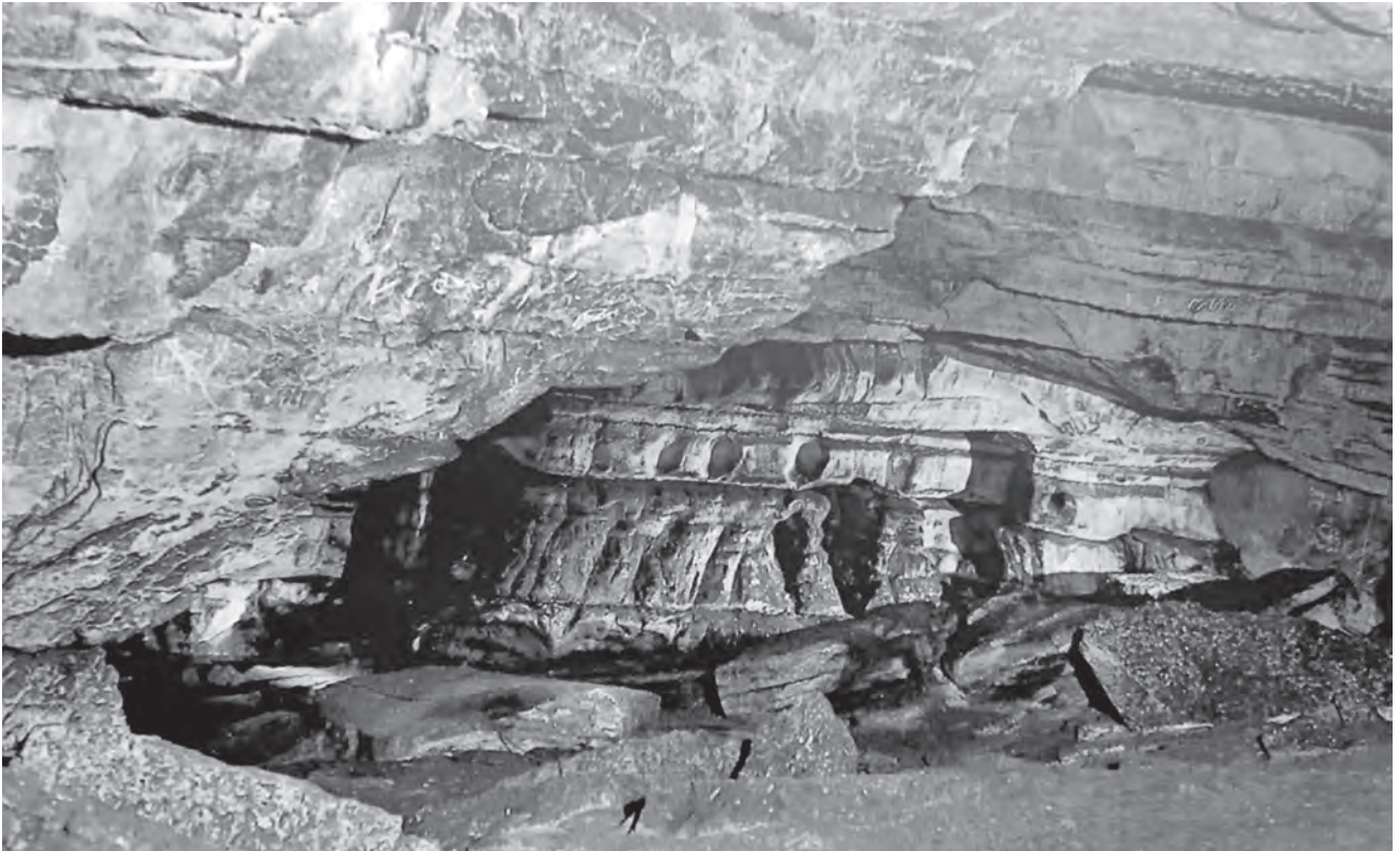
Большой зал Игнатъевской пещеры, над которым находится слой известняка толщиной от 25 до 30 м

Тогда в этих пещерах было обнаружено свыше 50 наскальных изображений каменного века. Речь идет об изображениях животных, в основном мамонтов, о различных рисунках, а также расплывчатых цветных пятнах. Большинство из них находится в так называемом Зале Рисунков. Диаметр этого грота составляет 40 м.