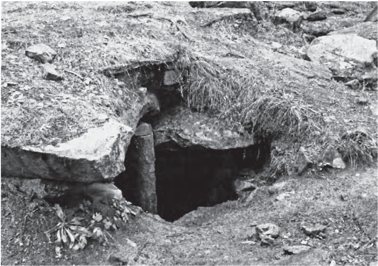
Укрепленный балками вход в одну из пещер на острове Веры

Конечно же, Вера — это из области легенды, но пещеры существуют на самом деле.