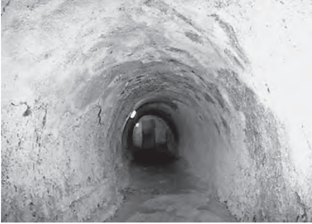
Туннель в Кунгурской ледяной пещере, появившейся более 10 000 лет назад

Меня отвез в Кунгур на своем старом «жигуленке» Володя, безработный врач родом из Норильска. Город с населением 68 000 человек скорее маленький для российских масштабов. Название Кунгур происходит из тюркского