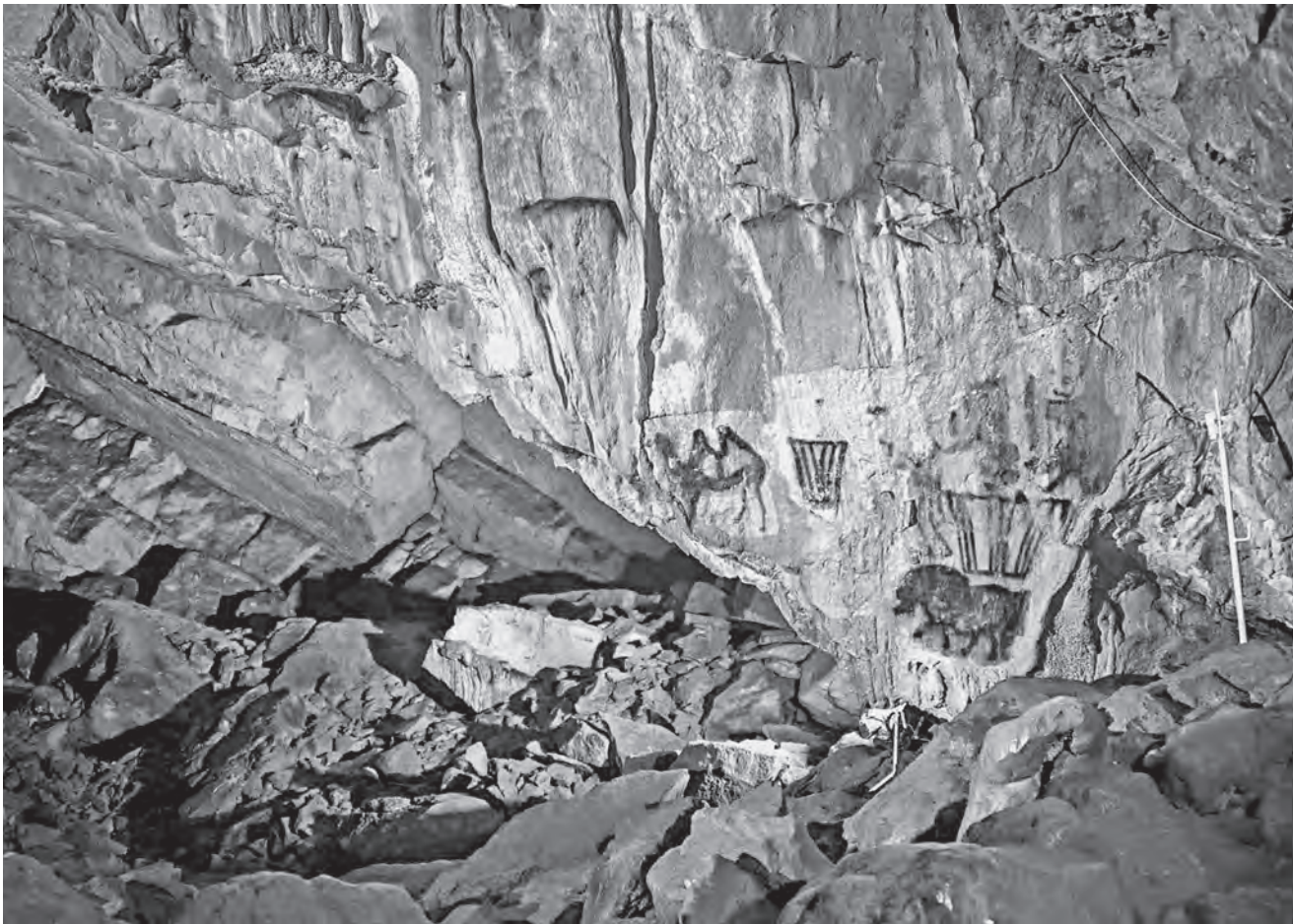
Зал Рисунков в Каповой пещере