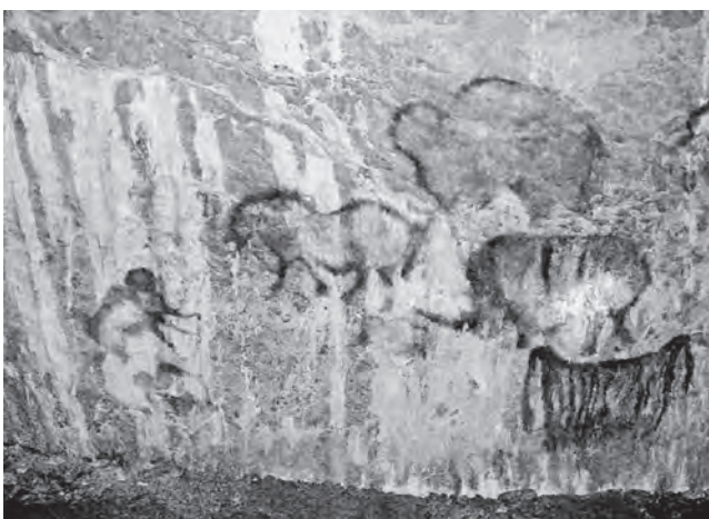
Изображение мамонта на стене Каповой пещеры, выполненное красной охрой