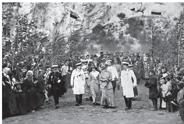
Принцесса Виктория Гессенская и принц Людвиг Баттенбергский посещают Кунгурскую ледяную пещеру во время путешествия по России в 1914 году

Следующий автобус должен был отходить только рано утром. Но функционирующая на тот момент система неофициальных такси позволила мне за несколько минут найти машину. Это выглядело, как и везде в России, одинаково: стоишь с вытянутой рукой на краю тротуара, делаешь характерные движения указательным и средним пальцами. Остановится либо старенький автомобиль советского производства, либо дорогая иномарка. Водитель советского автомобиля использует свой личный транспорт, чтобы обеспечить себе приработок. Водителю западной иномарки легче. Он пользуется отсутствием своего шефа, государственного служащего или бизнесмена, чтобы немного прибавить к своей зарплате.