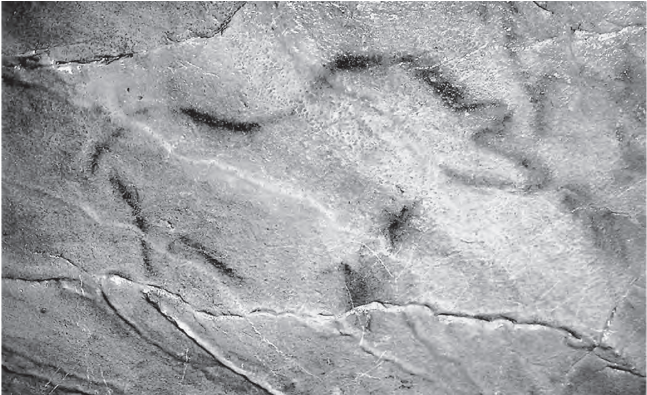
Одно из наиболее сохранившихся изображений лошади в Игнатьевской пещере

с марксизмом-ленинизмом. Но каждый ведь знал, да и все знали, как можно сохранить эту видимость. Если предисловие написано верно и в работах пару десятков раз процитирован Ленин, можно было публиковать исследовательские труды, которые сегодня уже немыслимы вообще. Кого интересует археология сейчас? Молодые люди хотят, конечно же, получить высшее образование, многие — даже два. Но они хотят стать экономистами или юристами. Но история, археология, пещерные исследования? Нет, это не для сегодняшней молодежи».