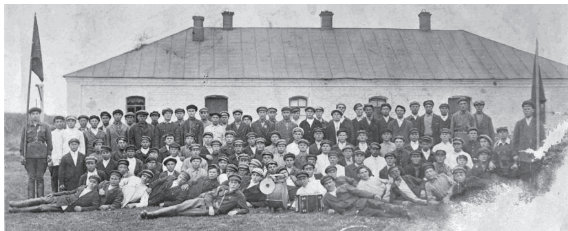
Участники районных сборов комсомольского актива у бывших конюшен княгини Е.В. Кудашевой, с. Митрофановка. 1920-е гг.

дарность родителям, воспитавшим достойного гражданина. Эта бумага оказалась спасительной. Колесниковых в Митрофановке оставили, и они вступили в колхоз «Большевик».