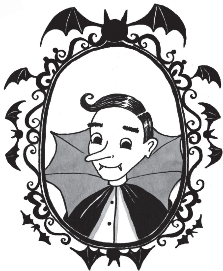
Мой папа, граф Бартоломью Мун