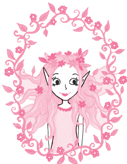
Моя мама, графиня Корделия Мун