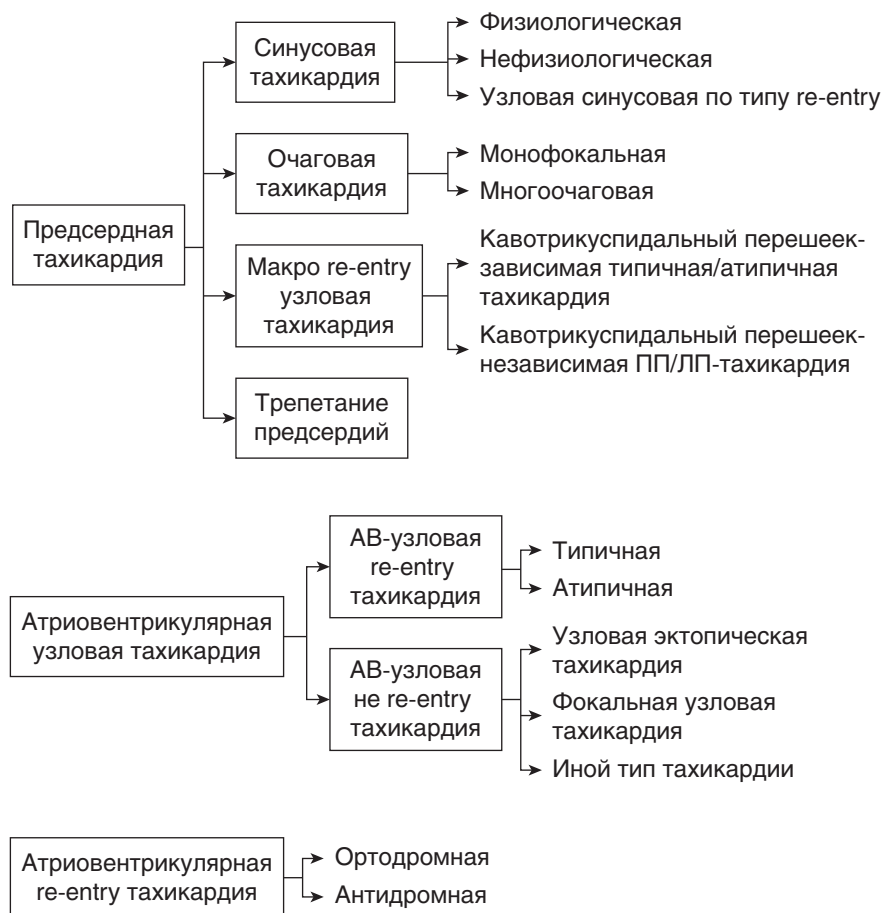
Рис. 1.1. Классификация наджелудочковых тахикардий. Re-entry — повторный вход; АВ — атриовентрикулярная; ЛП — левое предсердие; ПП — правое предсердие

Классификация наджелудочковых аритмий представлена на рис. 1.1.