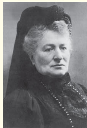
Клементина Деклер. Ок. 1910