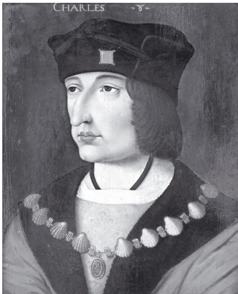
Король Франции Карл VIII

Командиры французской армии, вторгшейся в Италию в 1494 году, придерживались иных взглядов на методы ведения войны. В итальянский порт Специя им доставили морем осадные орудия. Пушки их были отлиты из бронзы, в отличие от итальянских, представлявших собой мед-