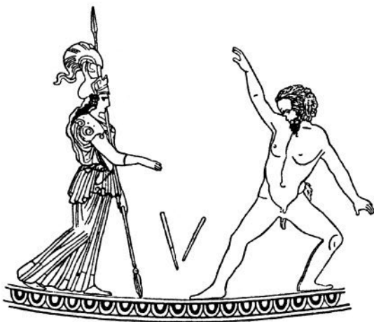
Марсий находит флейту, брошенную Афиной (рисунок на вазе)

с ним в музыке. Кифаред 1 Аполлон не снес такой дерзости. Однажды, блуждая по полям Фригии, Марсий нашел тростниковую флейту. Ее бросила богиня Афина, заметив, что игра на изобретенной ею самой флейте обезображивает ее божественно прекрасное лицо. Афина прокляла свое изобретение и сказала: