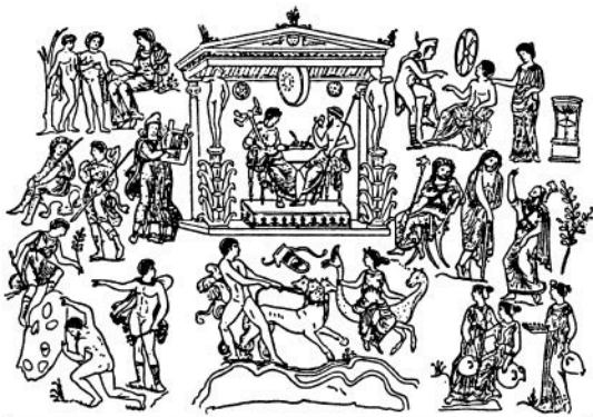
Царство Аида. В центре — Аид и Персефона (рисунок на вазе)

мрачные берега. В подземном царстве струятся и дающие забвение всего земного воды реки Леты 1 . По мрачным полям царства Аида, заросшим бледными цветами асфодела 2 , носятся бесплотные легкие тени умерших. Они сетуют на свою безрадостную жизнь, без света и без желаний. Тихо раздаются их стоны, едва уловимые, подобные шелесту увядших листьев, гонимых осенним ветром. Нет никому возврата из этого царства печали. Трехглавый адский пес Кербер 3 , на шее которого движутся с грозным шипением змеи, сторожит выход. Суровый старый Харон, перевозчик душ умерших, не повезет через мрачные воды Ахеронта ни одну душу обратно, туда, где светит ярко солнце жизни. На вечное безрадостное существование обречены души умерших в мрачном царстве Аида.