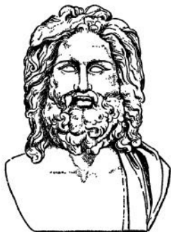
Зевс (с античной статуи)

них, громовержец Зевс, взял себе небо, Посейдон — море, а Аид — подземное царство душ умерших. Земля же осталась в общем владении. Хотя и поделили сыновья Крона между собой власть над миром, но все же над всеми ними царит повелитель неба Зевс; он правит людьми и богами, он веда-ет всем в мире.