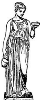
Геба (со статуи Торвальдсена)

Не один Зевс хранит законы. У его трона стоит хранящая законы богиня Фемиды. Она созывает, по повелению громовержца, собрания богов на светлом Олимпе, народные собрания на земле, наблюдая, чтобы не нарушился порядок и закон. На Олимпе и дочь Зевса, богиня Дикэ, наблюдающая за правосудием. Строго карает Зевс неправедных судей, когда Дикэ доносит ему, что не соблюдают они законов, данных Зевсом. Богиня Дикэ — защитница правды и враг обмана.