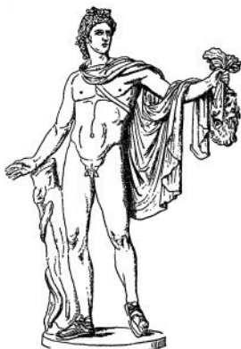
Аполлон Бельведерский (с античной статуи)

токудрого Аполлона. Тогда раздался звон тетивы серебряного лука, как искра сверкнула в воздухе не знающая промаха золотая стрела, за ней другая, третья; стрелы дождем посыпались на Пифона, и он бездыханный упал на землю. Громко зазвучала торжествующая победная песнь (пэан) златокудрого Аполлона, победителя Пифона, и вторили ей золотые струны кифары бога. Аполлон зарыл в землю тело Пифона там, где стоят священные Дельфы, и основал в Дельфах святилище и оракул, чтобы прорицать в нем людям волю отца своего, Зевса.