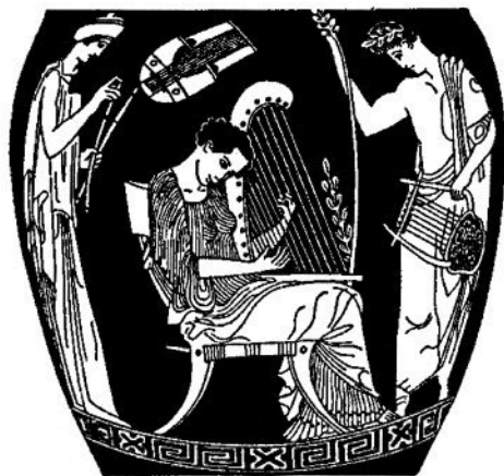
Музы и Аполлон (рисунок на вазе)

с девятью музами. Юные, прекрасные музы, дочери Зевса и Мнемосины 1 , — постоянные спутницы Аполлона. Он предводительствует хором муз и сопровождает их пение игрой на своей золотой кифаре. Величаво идет Аполлон впереди хора муз, увенчанный лавровым венком, за ним следуют все девять муз: Каллиопа — муза эпической поэзии, Эвтерпа — муза лирики, Эрато — муза любовных песен, Мельпомена — муза трагедии, Талия — муза комедии, Терпсихора — муза танцев, Клио — муза истории, Урания — муза астрономии и Полигимния — муза священных гимнов. Торжественно гремит их хор, и вся природа, как зачарованная, внимает их божественному пению.