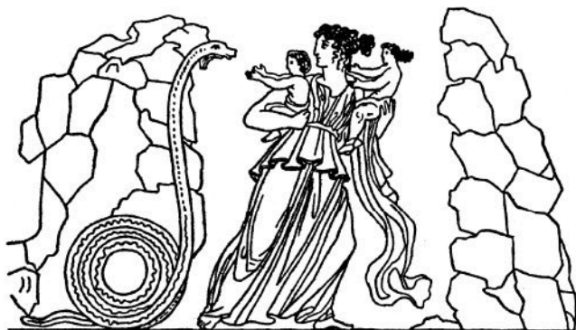
Пифон преследует Латону и ее детей, Аполлона и Артемиду (рисунок на вазе)

Борьба Аполлона с Пифоном и основание Дельфийского оракула. Юный, светозарный Аполлон понесся по лазурному небу с кифарой 1 в руках, с серебряным луком за плечами; золотые стрелы громко звенели в его колчане. Гордый, ликующий, несся Аполлон высоко над землей, грозя всему злему, всему порожденному мраком. Он стремился туда, где жил грозный Пифон, преследовавший его мать Латону; он хотел отомстить ему за все зло, которое тот ей причинил.