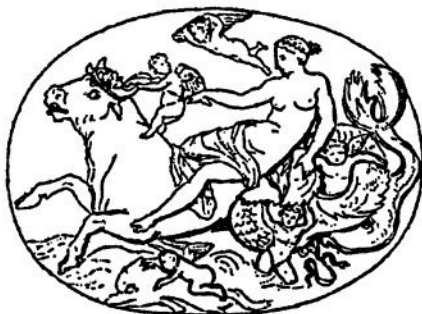
Амфитрита (с античной камеи)

Глубоко в пучине моря стоит чудесный дворец великого брата громовержца Зевса, колебателя земли Посейдона. Властвует над морями Посейдон, и волны моря послушны малейшему движению его руки, вооруженной грозным трезубцем. Там, в глубине моря, живет с Посейдоном и его прекрасная супруга Амфитрита, дочь морского вешего старца Нерея, которую похитил великий властитель морской глубины Посейдон у ее отца. Он увидел однажды, как водила она хоровод со своими сестрами-нереидами на берегу острова Наксос. Пленился бог моря прекрасной Амфитритой и хотел увезти ее на своей колеснице. Но Амфитрита укрылась у титана Атласа, который держит на своих могучих плечах небесный свод. Долго не мог Посейдон найти прекрасную дочь Нерея. Наконец открыл ему ее убежище дельфин; за эту услугу