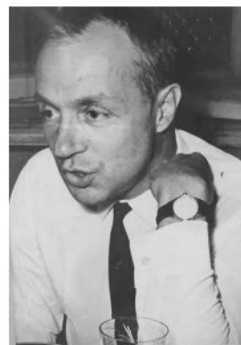
Станислав Долецкий, 1985 г.