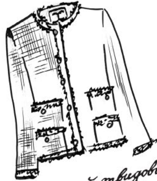
Маленький мблговблбл макет