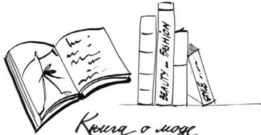
Книга о моде