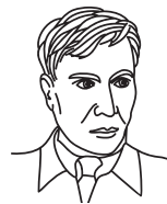
Б. Л. Пастернак