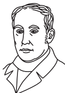
В. А. Жуковский