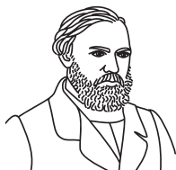
А. Н. Островский