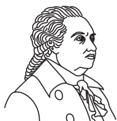
Д. И. Фонвизин