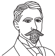
И. А. Бунин