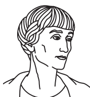
А. А. Ахматова