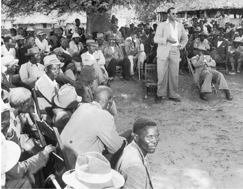
Рисунок 5. Серетсе Кхама обращается к суду племени в Серове, 1949 г.

Соединенного Королевства, а теперь, по причине этого брака, бывшая сотрудница Лондонского Ллойда 1 . Ее уволили сразу после того, как общественность узнала о ее замужестве [2].