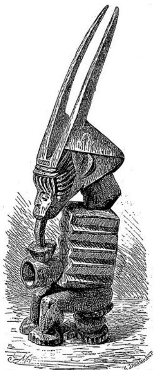
Деревянный идол с Нигера. Из книги Ф. Ратцеля «Народоведение». 1894 г.

ставления. О душах умерших они думают, что после недолгого пребывания на земле они восходят на облака, где обыкновенно и остаются; впрочем, им ничто не препятствует возвратиться на землю, но в таком случае они меняют свой цвет и становятся белыми. Поэтому на европейцев они смотрят как на выходцев с того света. Однако это воззрение не мешает австралийцам делать своими женами случайно захваченных ими белых женщин. Из этого видно, что их представления о духах неясны и сбивчивы. Подобно другим дикарям, они имеют колдунов, или волшебников, призываемых на помощь при всяких необыкновенных обстоятельствах, как, например, в случае болезни, и действующих таким же способом и такими же средствами, как это делается и у других народов. Могущество этих чародеев основывается, как полагают, на близком их общении с духами; но что это за духи — суть ли это души умерших, еще не покинувшие землю, или, может быть, это злые духи, о которых тоже иногда говорится, — об этом нельзя получить никакого объяснения. Возможно, что и для самих посвященных в чародейство это неясно. Во всяком случае, наши сведения об этом так недостаточны, что мы можем оставить австралийских негров в стороне.