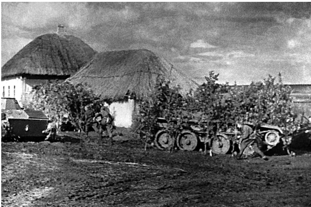
Танки БТ-7 и Т-60, замаскированные в одном из украинских сел. Юго-Западный фронт, май 1942 года. Скорее всего, машины из состава 10-й танковой бригады.

из района Балаклеи и армейской группы генерала Клейста (1-я танковая и 17-я армии) из района Славянска и Краматорска в общем направлении на Изюм окружить и уничтожить советские войска на барвенковском выступе и захватить плацдарм в районе Изюма, который в дальнейшем должен был стать исходным рубежом для развития наступления. Операция «Фридрикус 1» должна была создать условия для развертывания наступления в направлениях Кавказа и Волги.