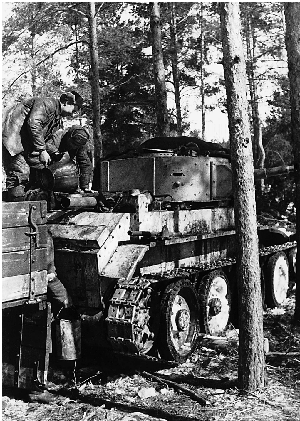
Заправка горючим (из ведра вручную) танка БТ-7 (с цилиндрической башней и зенитной турелью). Юго-Западный фронт, апрель 1942 года. Скорее всего, машина из состава 10-й танковой бригады.

жения советских войск не осталось никаких документов о численности большинства этих частей, поэтому приводимые данные выглядят фрагментарно. Рассмотрение численного состава танковых частей Юго-Западного и Южного фронтов будет произведено по всей известной информации о бригадах