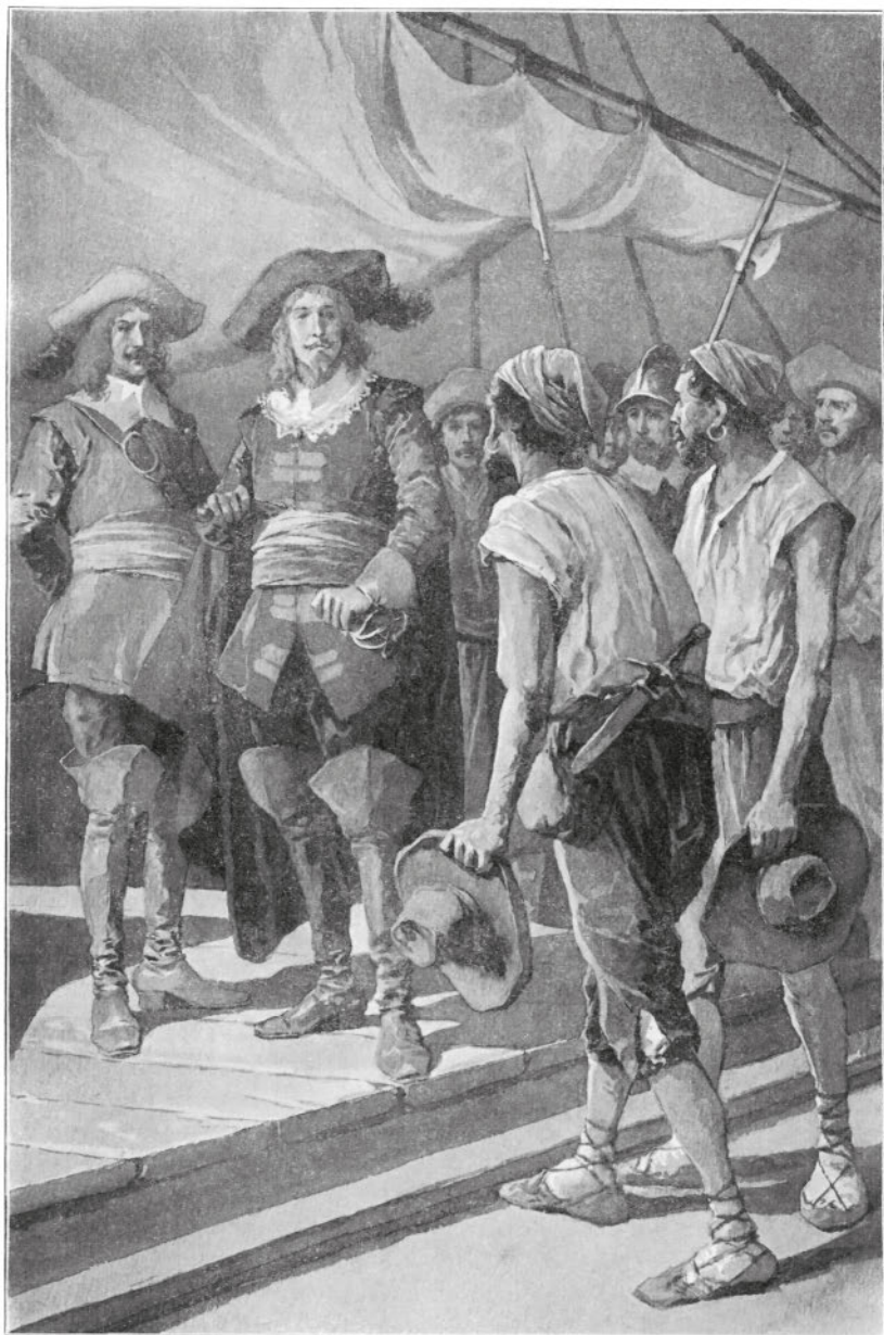
С капитанского мостика сошел человек и направился к ним, держа руку на пистолете.