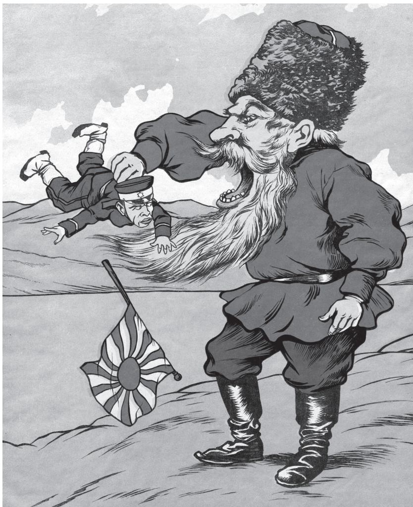
Милитаристский плакат времен русско-японской войны

что стоил бы выкуп всех негров юга). Все знают, не могут не знать главного, что войны, вызывая в людях самые низкие, животные страсти, развращают, озверяют людей. Все знают неубедительность доводов, приводимых в пользу войн, в роде тех, которые приводил Де-Местр, Мольтке и другие,