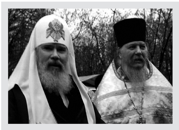
Святейший Патриарх Алексий II и протоиерей Димитрий Смирнов

и Святая Троица непосредственно участвуют в жизни нашего Патриарха.