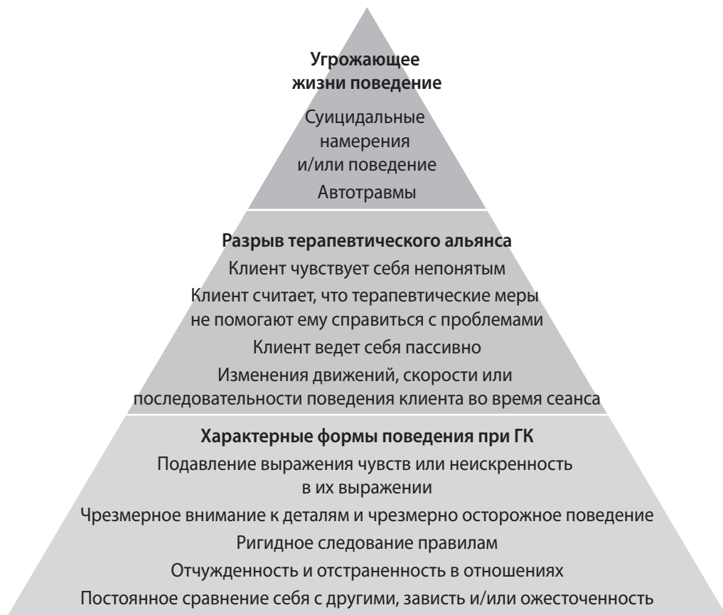
Рис. 1.1. Иерархия целей индивидуального лечения при проблемах с ГК

В учебнике по РО ДПТ детально описаны меры воздействия для каждого уровня этой иерархии.