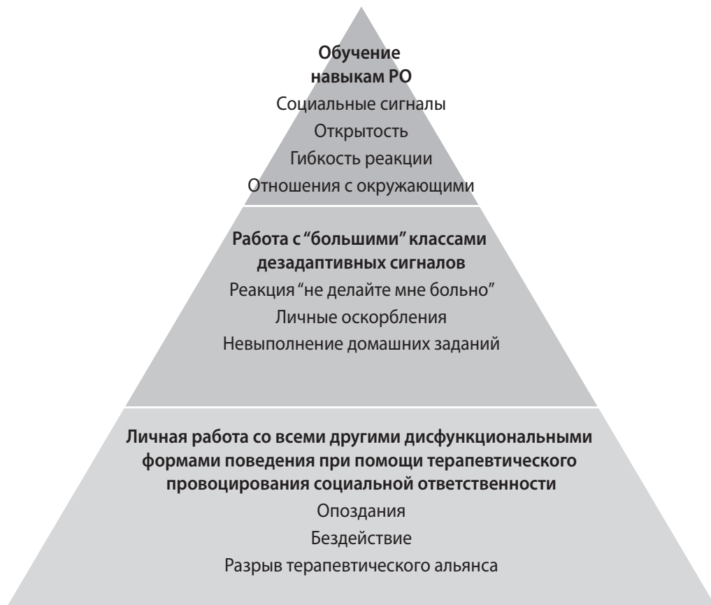
Рис. 1.2. Иерархия целей обучения навыкам РО

ДПТ). Терапевту необходимо подчеркнуть, что главная цель обучения навыкам РО — это освоение новых навыков, а не работа с внутренними ощущениями или раскрытие глубоко личной информации. Важно, чтобы терапевт представил эти занятия скорее в виде обычных уроков, а не групповых занятий, которые ассоциируются с терапией. Упоминание об обучении навыкам РО как о тренинге не только в большей степени отвечает их основной задаче (т.е. освоению новых навыков), но и помогает снизить автоматическое избегание клиентами с ГК, у которых с групповыми занятиями могут быть связаны неприятные воспоминания.