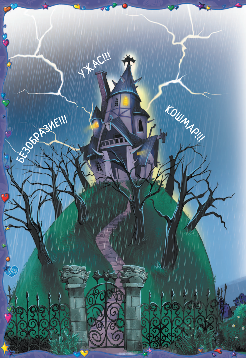
Иллюстрация А. С. Сидорова