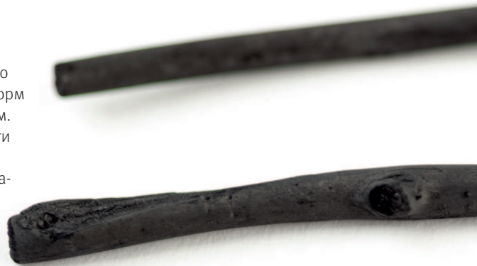
Ивовые угольные палочки

Растушевка (или растушка). Этими бумажными валиками можно растушевать уголь. Подробнее процесс расписан на странице 81.