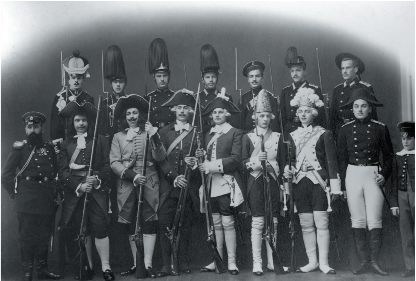
3. Кадеты Морского кадетского корпуса в реконструированных мундирах. 1901 г. ЦВММ [548] 3. Cadets of the Naval Cadet Corps wearing the reconstructed uniforms, 1901

изучаемой эпохе толковым словарем является «Словарь Академии Российской», первый толковый словарь русского языка, изданный в 1789–1794 гг. Важно учитывать, что этот словарь иногда отражает особенности словоупотребления сравнительно узкой группы или короткого периода. Например, слово «каламянок» словарь толкует как «шерстяное исткание одноцветное или с полосками разных цветов, а иногда и с цветочками» [617], тогда как в первой половине XIX в. каламянок – «гладкая пеньковая или льняная ткань, беленая или суровая, похожая на демикотон» [610]. Согласно современному определению: «льняная ткань атласного переплетения, с настилом из уточных нитей на лицевой стороне, суровая, полубеленая или беленая» [612]. Учитывая, что каламянок в первой половине XVIII в. изготавливался на парусиновой фабрике, мы полагаем, этот термин означал в изучаемый нами период только льняную ткань.