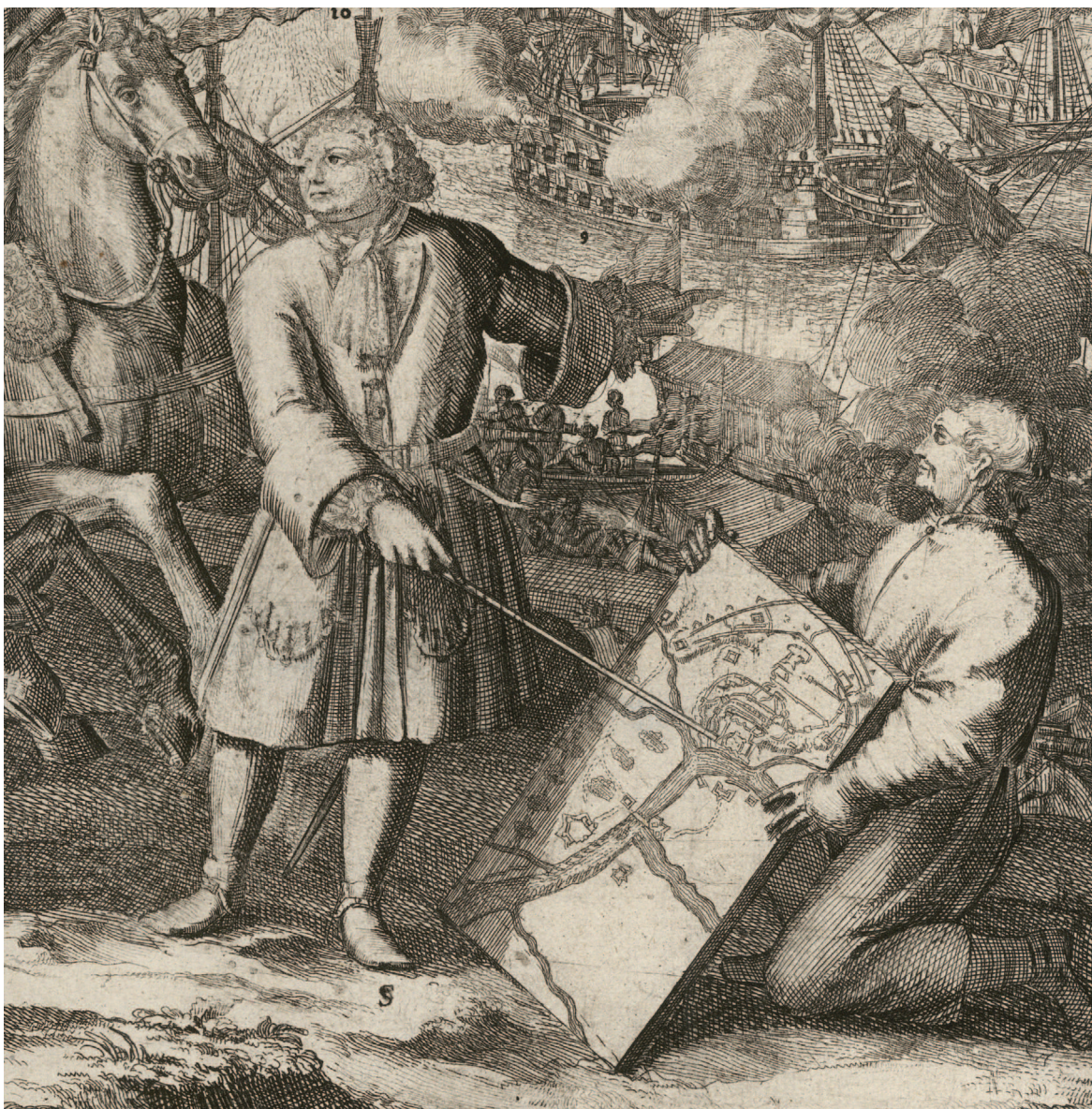
1. Схоонебек (Шхонебек) А. Осада турецкой крепости Азов...

Инженер Ф. Ф. Тиммерман. 1696 г. ГЭ [494, фрагм.]