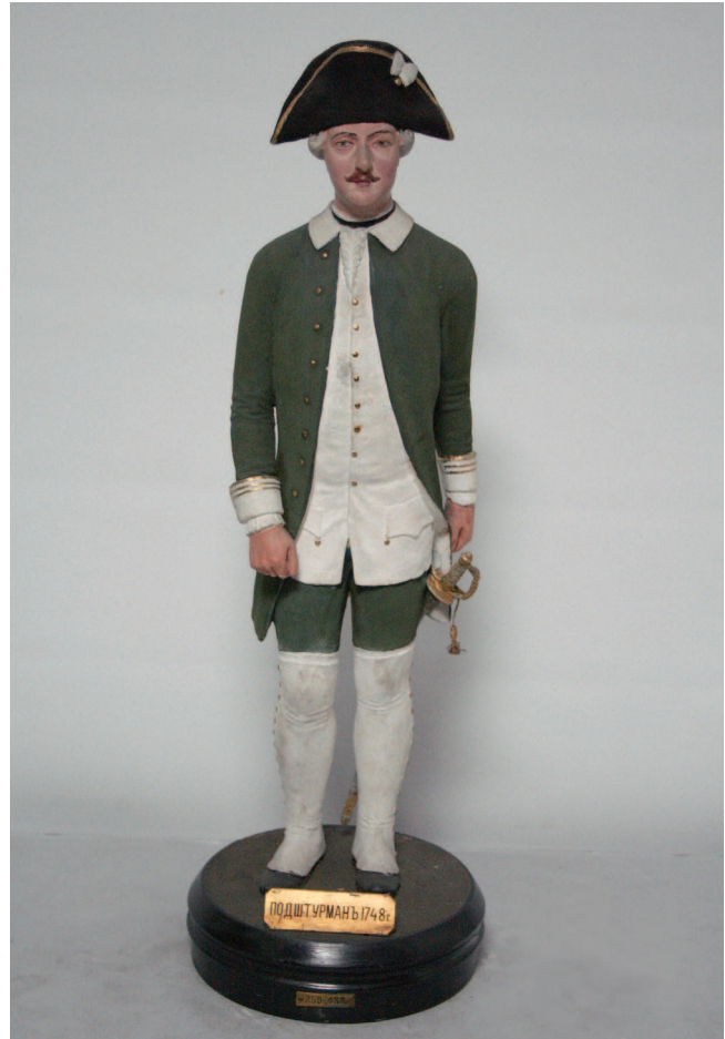
5. Сафонов А. П. Подштурман 1748 года. 1890-е гг. ЦВММ [489] 5. Alexander Safonov, A Master's mate, 1748, 1890s.

Недавно в одном из зданий Первого кадетского корпуса в Петербурге было обнаружено большое количество предметов обмундирования [556 б; 577 б; 577 в; 591]. Они были найдены под полом помещения, построенного на рубеже 30–40-х гг. XVIII в., причем вещи несут следы сильного износа, а иногда и вторичного использования (рукав от рубашки, возможно, функционировал в качестве мешочка или чехла). Поэтому мы полагаем, что эти предметы бытовали в 20–30-е гг. Они не имеют прямого отношения к флоту, но позволяют судить о типовой для военной среды одежде и аксессуарах.