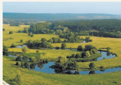
На Русской равнине