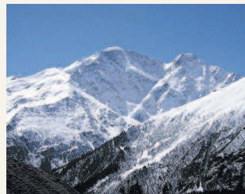
В горах Кавказа