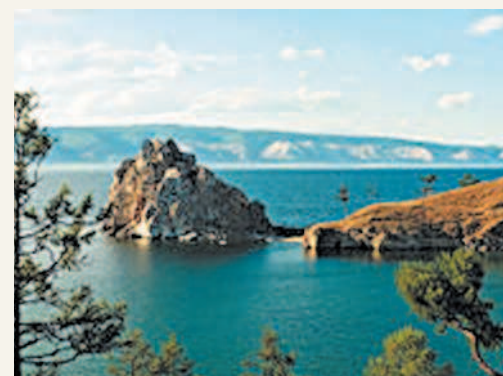
Байкал — природная жемчужина России

рии. В одном озере Байкал содержится около 19% мировых запасов пресной воды. Половина всех земель России занята лесами. Леса играют важную роль в газовом балансе атмосферы и регулировании планетарного климата Земли. В России находится пятая часть всех лесов мира и половина мировых хвойных лесов. Животный мир разнообразен. Количество видов животных на территории России достигает 125 тыс.