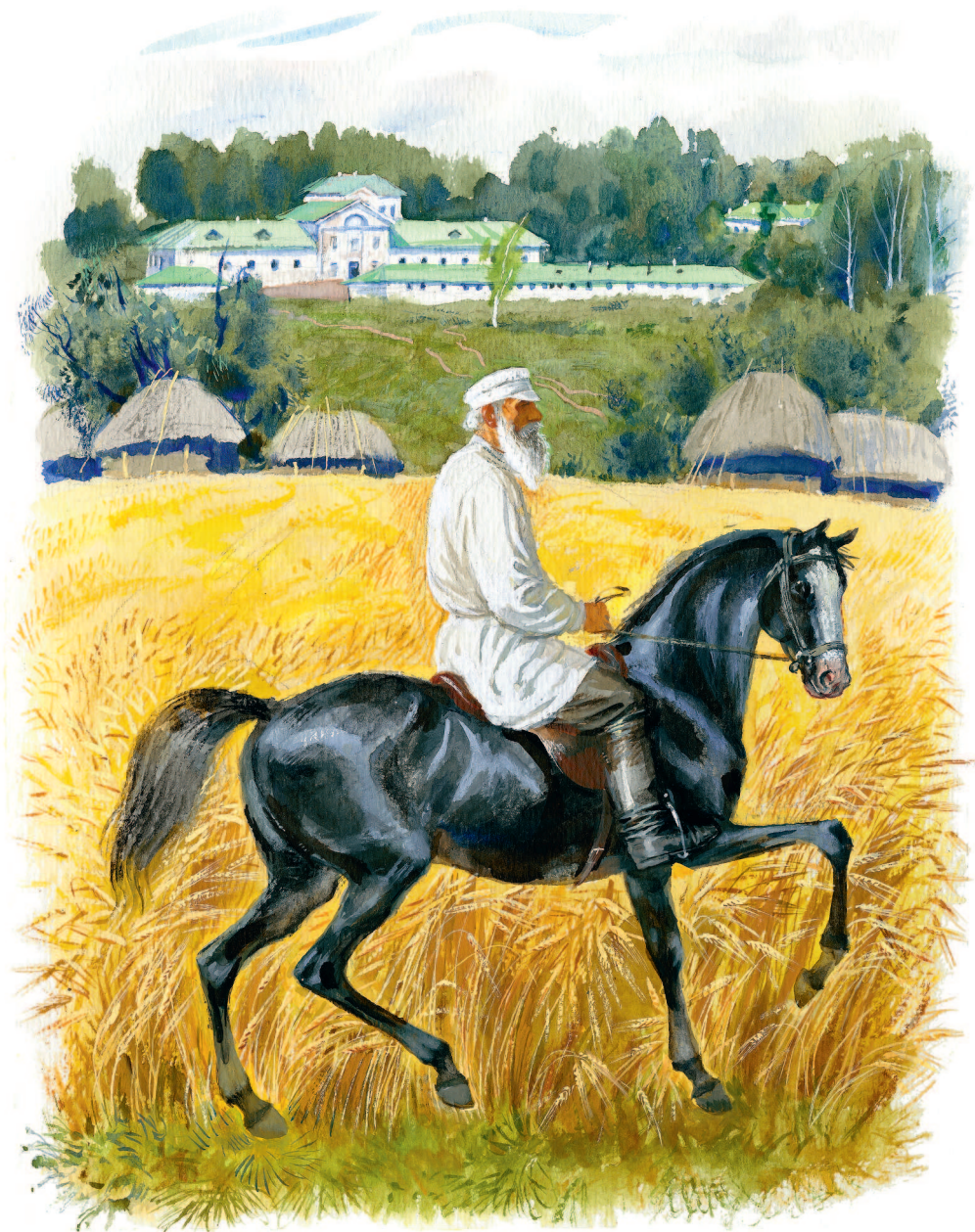
Рисунки Н. Устинова