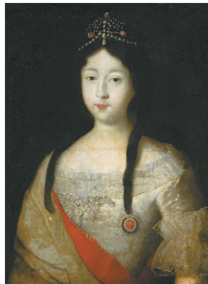
Великая княгиня Анна Петровна.

Орден учрежден в 1735 г. и назван в честь дочери царя Петра I Анны ее мужем Карлом Фридрихом, герцогом из немецкой династии Готторпов, правивших в исторической области Гольштейн.