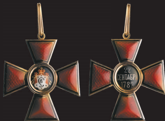
Знак ордена Святого Владимира I или II степени (аверс и реверс).

Кавалеры I степени имели знаки: крест на ленте, надетой через правое плечо, и звезду на левой стороне груди; II степени — такой же крест на шее и звезду, награжденные III степенью носили крест меньших размеров на шее, а IV — крест в петлице (на груди).