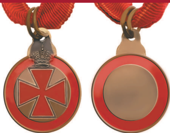
Аннинская медаль — Знак отличия ордена Святой Анны (аверс и реверс).

Первым орденом, к которому был представлен будущий великий полководец А. В. Суворов, стал как раз орден Святой Анны. Эту же награду еще при императрице Елизавете Петровне получил отец Суворова. В 1789 г. ордена Святой Анны удостоился будущий победитель Наполеона М. И. Кутузов.