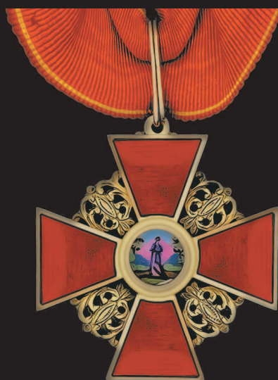
Крест ордена Святой Анны II степени с шейной лентой. Золото, 42 × 42 мм.

Знаки выполнены в виде золотых крестов с четырьмя расширяющимися к концам лучами, покрытыми с обеих сторон красной эмалью; промежутки между лучами заполнены ажурным орнаментом. В центре, в медальоне, изображение Святой Анны в полный рост на фоне пейзажа, а на оборотной стороне — синего цвета стилизованный вензель из сдвоенных заглавных литер девиза AJPF на белом поле. В конце XVIII в. и в начале XIX в. знаки высших степеней украшались хрустальными стразами или алмазами.