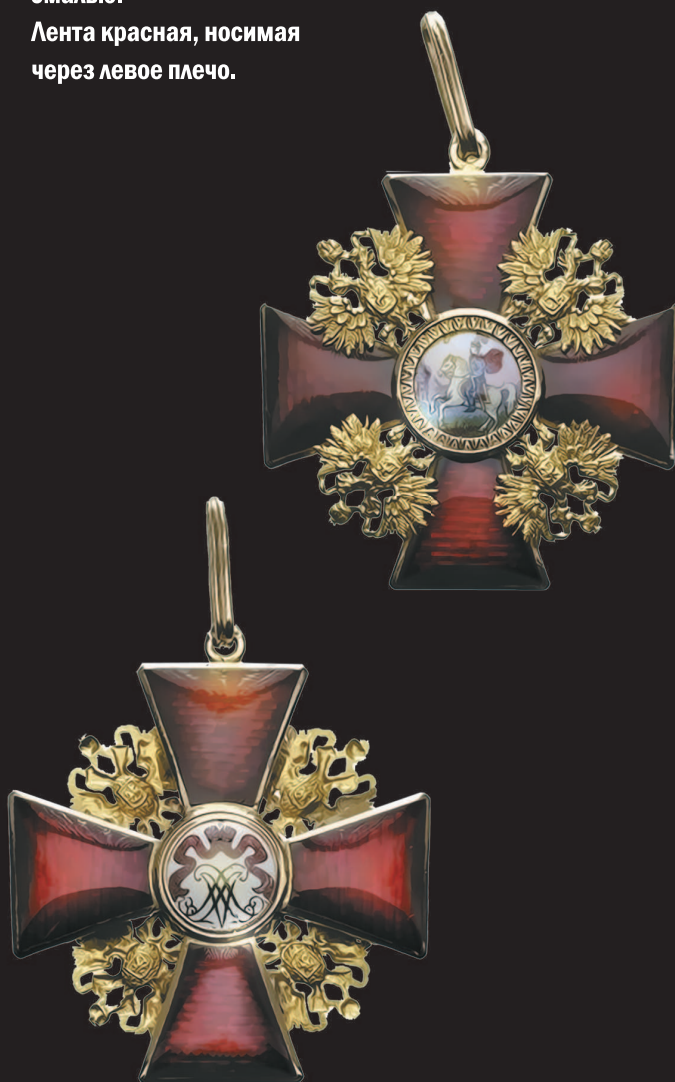
Крест ордена (аверс и реверс).

Лента красная, носимая через левое плечо.