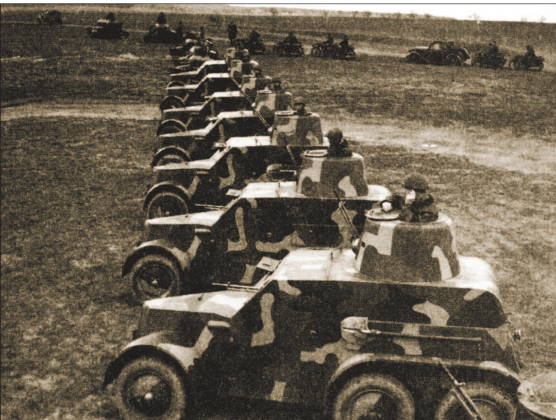
Чехословацкие бронемшины OA vz.30, которые после аннексии Судетской области и захвата Чехословакии начали поступать на вооружение вермахта.

В результате оккупации Чехословакии немцы получили доступ к чехословацкой военной технике, в том числе и к танкам. LT vz.38 был принят на вооружение немецкой армии под обозначением Pz.Kpfw.38(t) и в первые годы Второй мировой войны считался одним из лучших легких танков вермахта.