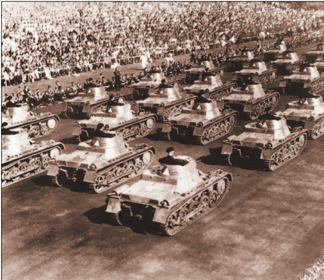
Танки на параде в 1935 г., посвященном Эрнтданкфесту — национальному празднику урожая. Создание бронетанковых войск в Германии являлось грубейшим нарушением положений Версальского договора.

мешала будущая союзница — Италия. Лишь после того, как Германия поддержала Италию в итало-эфиопской войне, правительство Б. Муссолини отказалось от включения Австрии в сферу своих интересов. 12 марта 1938 г. германские войска вступили в Австрию. Уже на следующий день Гитлер подписал документ о полном аншлюсе Австрии, сделав эту страну провинцией Германии. Бескровная победа, одержанная А. Гитлером над Австрией, позволила Германии увеличить свою территорию почти на 17% и получить доступ к богатым промышленным и сырьевым районам.