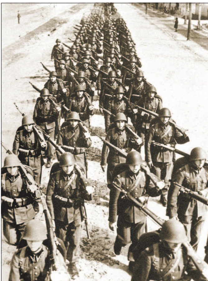
Польские пехотинцы на марше. 1939 г.