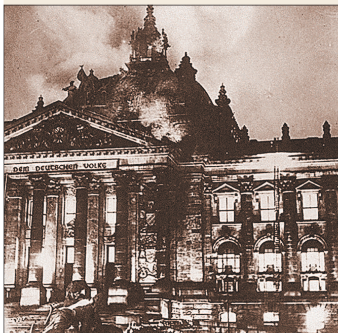
Горящее здание Рейхстага. 27 февраля 1933 г.

Нацисты объявили поджог Рейхстага результатом коммунистического заговора, направленного на срыв выборов, что позволило им начать массовые аресты коммунистов. В одном только Берлине в ночь на 28 февраля было арестовано 1500 человек, а по всей стране — более 10 тыс. коммунистов. Во время массовых арестов фашистам удалось 3 марта 1933 г. схватить Э. Тельмана, лишив компартию наиболее стойкого и целеустремленного руководителя. 28 февраля, на следующий после пожара день, Гитлер представил на подпись президенту Гинденбургу проект декрета «Об охране народа и государства», приостанавливавшего действие семи статей конституции, которые гарантировали свободу личности и права граждан.