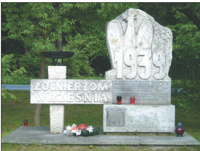
Памятник польским солдатам, погибшим в бою с немецкими войсками 6—7 сентября 1939 г. во время обороны города Краков.