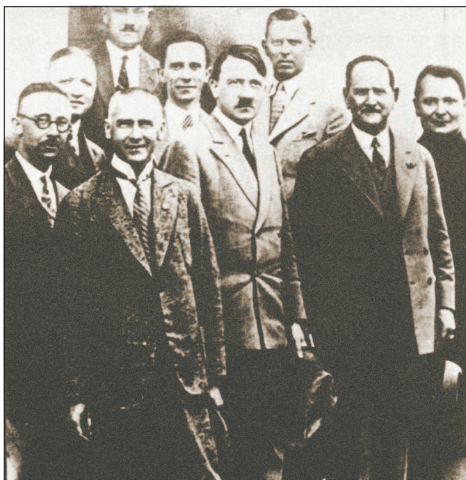
Руководство НСДАП в конце 1920-х гг. В центре А. Гитлер, который занимал пост председателя партии с 29 июля 1921 г. по 30 апреля 1945 г.

президенты, главы правительств, послы, министры и маршалы двадцати шести стран. В этот же день состоялось подписание Версальского мирного договора с Германией, официально завершившего Первую мировую войну. Отдельными статьями договора существенно ограничивалась военная мощь Германии. В частности, Германии запрещалось иметь многие современные виды вооружения, например боевую авиацию и бронетехнику.