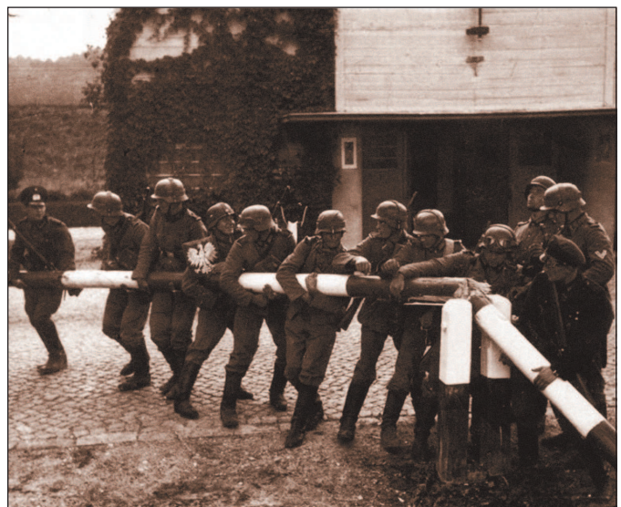
Немецкие солдаты ломают шлагбаум на пограничном пункте в Сопоте (граница Польши и Вольного города Данцига). 1 сентября 1939 г.

Наступление на Польшу началось 1 сентября 1939 г. в 4 ч 40 мин массированным ударом с воздуха. Польские военно-воздушные силы были застигнуты врасплох, что позволило немцам в короткий период добиться господства в воздухе.