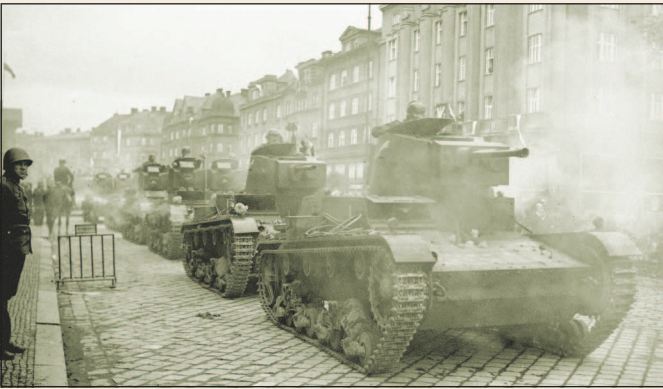
Польские танки на территории Чехословакии.

В ночь с 30 сентября на 1 октября Польша, а затем и Венгрия, правительства которых были воодушевлены решениями Мюнхенской конференции, предъявили Чехословакии ультиматум о передаче территорий, населенных польским и венгерским национальными меньшинствами. Уже на следующий день польские части вошли на территорию Тешинской области, находящейся на севере Чехословакии, и в первые же два дня заняли территорию, на которой проживало 80 тыс. поляков и 125 тыс. чехов.