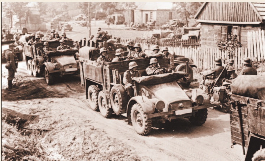
Моторизованные части вермахта в Польше. 1939 г.

Успешному продвижению германских войск во многом способствовало активное использование бронетанковых и моторизованных войск. В отличие от Первой мировой войны, когда наступление шло медленно и одновременно по всему фронту, новая тактика германских войск основывалась в большей степени на скорости действий. Основная задача заключалась в прорыве обороны противника и дальнейшем развитии наступления вглубь, а не по всему фронту. При этом узлы сопротивления, укрепленные районы, противотанковые препятствия, населенные пункты обычно обходились или отыскивались участки наименьшего сопротивления, ведущие в тыл противника. Такая тактика во многом была рискованна, так как по логике вещей противник мог легко отрезать прорвавшиеся части. Однако этот риск сводился к нулю благодаря разрушению механизмов управления войсками, подавлению морального духа противника и налаживанию умелого взаимодействия между своими родами войск.