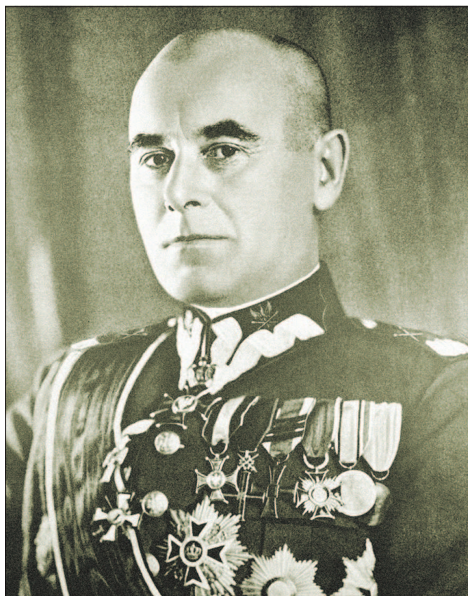
Верховный главнокомандующий польской армией в начале Второй мировой войны Э. Рыдз-Смиглы (1886—1941).