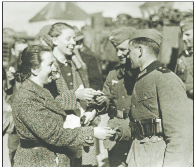
Австрийские женщины вручают подарки германским солдатам. 13 марта 1938 г.

4 февраля 1938 г. ушел в отставку главнокомандующий немецкой армией фельдмаршал Вернер фон Бломберг, и Гитлер официально объявляет себя главнокомандующим вооруженными силами. При главнокомандующем создается штаб — «верховное командование вооруженными силами» (ОКВ). Начальником главного штаба ОКВ был назначен 55-летний генерал артиллерии В. Кейтель. «Мозговым центром» штаба стало управление руководства вооруженными силами (с 8 августа 1940 г. — штаб оперативного руководства), которое возглавил генерал артиллерии А. Йодль.