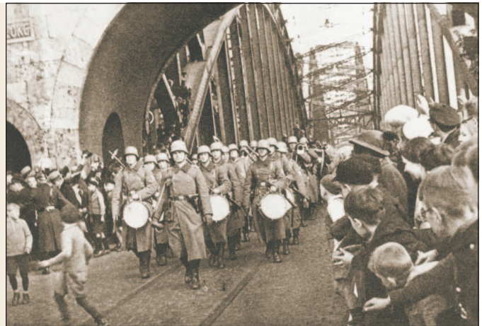
Немецкие войска маршируют через мост Гогенцоллернов — железнодорожный мост через реку Рейн. 7 марта 1936 г.

Гитлер долго не решался отдать приказ на оккупацию демилитаризованной Рейнской зоны, наблюдая за реакцией мировой общественности на войну, развязанную Италией против Эфиопии (Итало-эфиопская война 1935—1936 гг.). Обнаружилось, что, несмотря на широко разрекламированные санкции, Лига Наций на деле оказалась бессильна остановить агрессора. 2 марта 1936 г. Гитлер отдает приказ приступить к операции, но в случае противодействия со стороны французских войск наступление планировалось прекратить и стремительно отступить за Рейн. Однако ни французское правительство, ни армия не предприняли никаких действий, когда утром 7 марта отряды немецких войск перешли через Рейн и вступили в демилитаризованную зону.