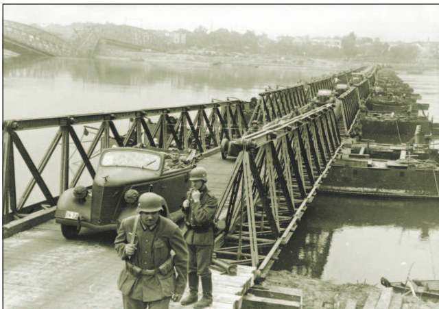
Немецкие солдаты переправляются через Вислу по мосту, построенному инженерными частями вермахта. Слева виден мост, разрушенный отступающей польской армией. 16 сентября 1939 г.

Не получив обещанной союзниками помощи, польские войска с боями отступали к Варшаве, пытаясь остановить продвижение армий группы «Юг». К моменту ввода в сражение армия «Прусы» еще не успела развернуться. 4 сентября в район Петркува прибыли только 19-я и 29-я пехотные дивизии и Виленская кавалерийская бригада. Эти соединения заняли оборону на широком фронте в значительном отрыве друг от друга. Связь со штабом армии «Лодзь» отсутствовала. Днем 5 сентября части 10-й немецкой армии вышли на подступы к Петркуву и при поддержке авиации атаковали 19-ю польскую пехотную дивизию и вышли в тыл армии «Прусы». Это вызвало панику в войсках, вскоре распространившуюся на весь участок фронта вплоть до Варшавы.