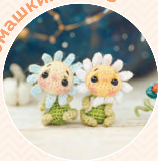
Ромашкин ♦ 173