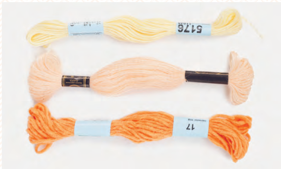
Мулине хлопковое, шерстяное и мулине «Гамма» Cloud

Также у «Гаммы» есть интересная ниточка для вышивки – Cloud («Клауд»). Она имеет фактурную, слегка пушистую текстуру, а ее толщина приблизительно равна двум хлопковым нитям мулине. Игрушки, связанные из этой нити, получаются на вид плюшевыми.