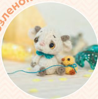
Козленок ♦ 121