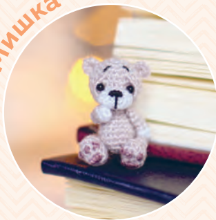
Мишка ♦ 137