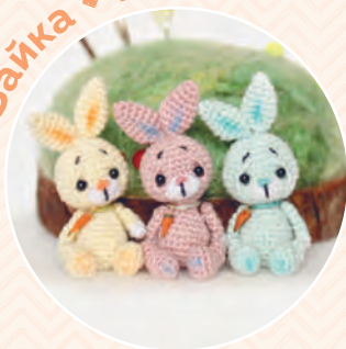
Зайка ♦ 149