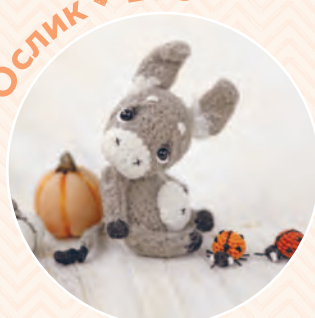
Ослик ♦ 159