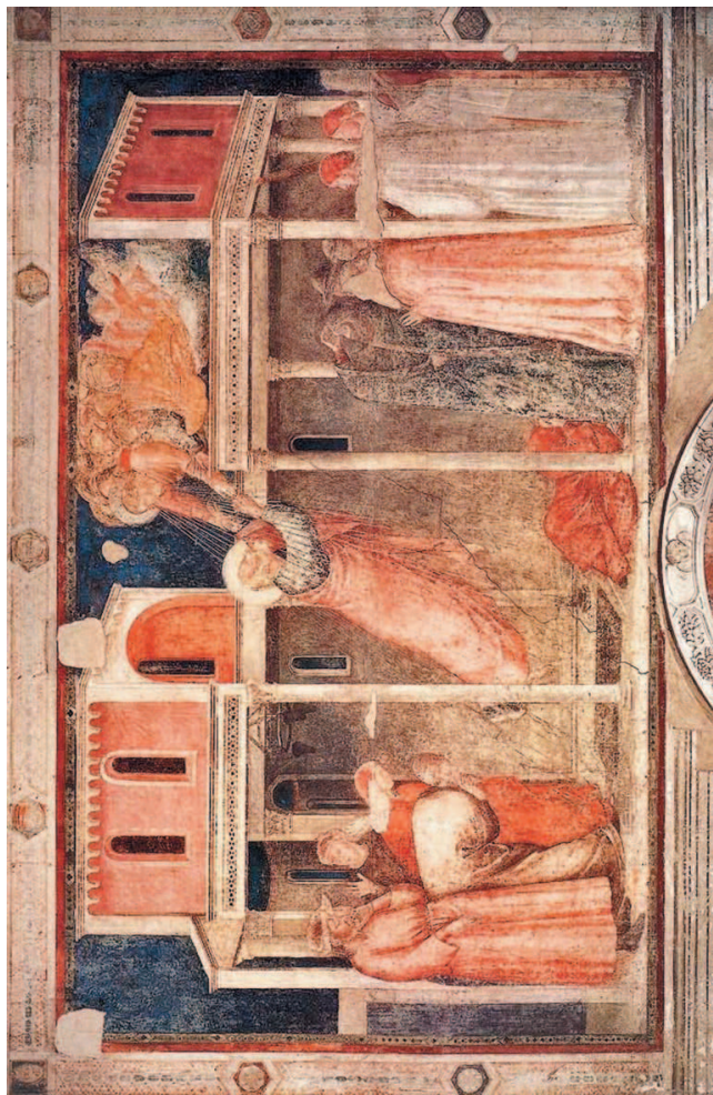
Джотто ди Бондоне. Вознесение Иоанна Богослова. Ок. 1315