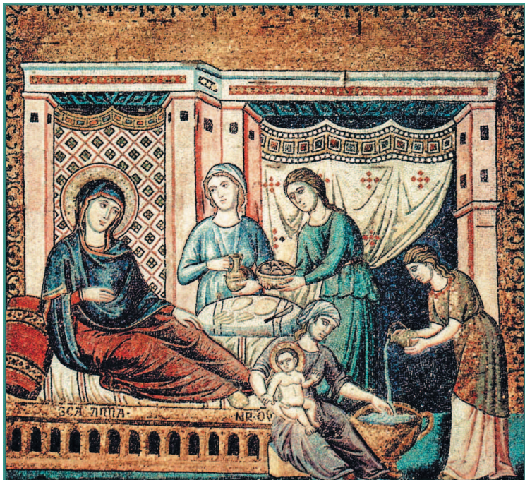
Пьетро Каваллини. Рождение Марии. 1291