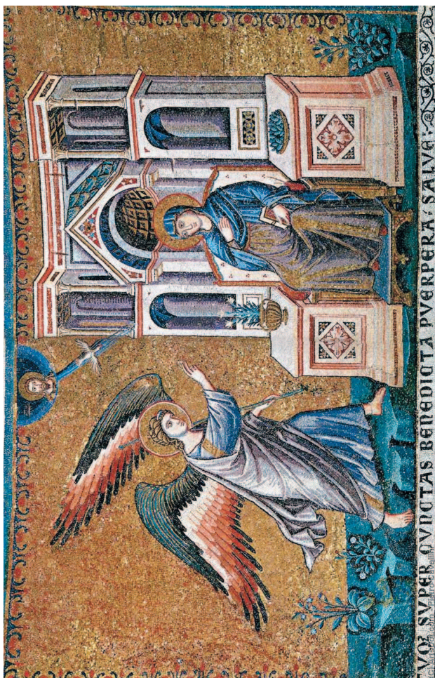
Пьетро Каваллини. Благовещение. 1291