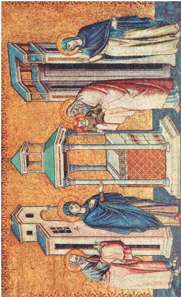
Пьетро Каваллини. Представление младенца Иисуса в храме. 1291