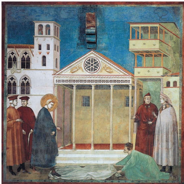
Джотто ди Бондоне. Сцены из жизни святого Франциска: юродивый предсказывает грядущую славу молодому святому Франциску. Ок. 1297–1300