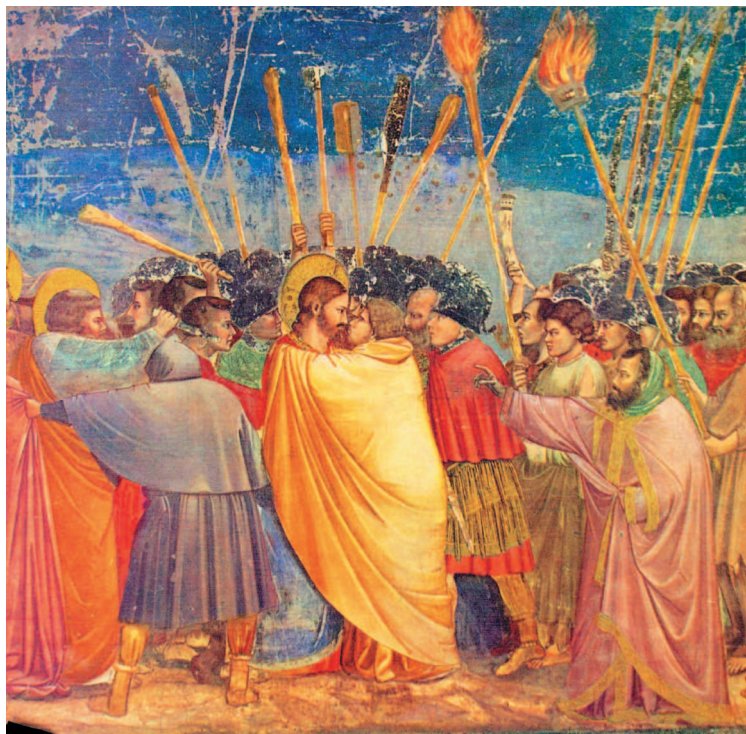
Джотто ди Бондоне. Арест Иисуса и поцелуй Иуды. Ок. 1304–1306