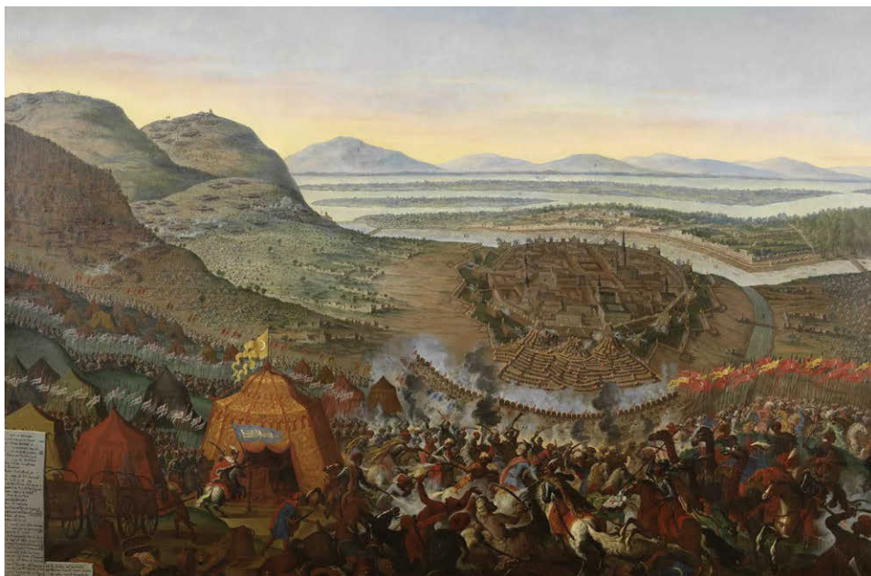
Битва за Вену 1683 года. Франц Геффельс. Холст, масло. 184 × 272 см. 1683–1694

Венские пекари просыпались очень рано, чтобы к завтраку испечь свежий хлеб. Пекарни тогда располагались в подвальных помещениях, поэтому именно булочки