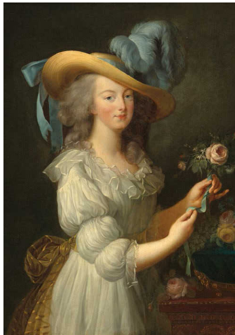
Мария-Антуанетта. Неизвестный художник. По мотивам портрета Элизабет Виже-Лебрён. Холст, масло. 92,7×73,1 см. После 1783

Я думаю, вам интересно узнать, когда и почему два диаметрально противоположных