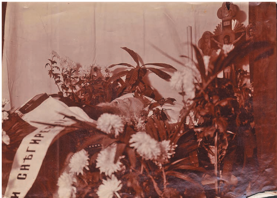
В. М. Савинков в гробу. 1905 г. (ГА РФ)