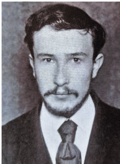
Б. В. Савинков. Рубеж XIX–XX вв.