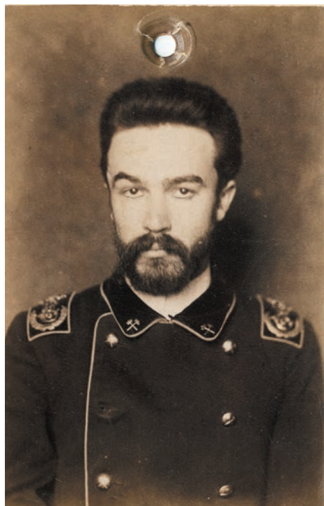
А. В. Савинков в форме студента Горного института