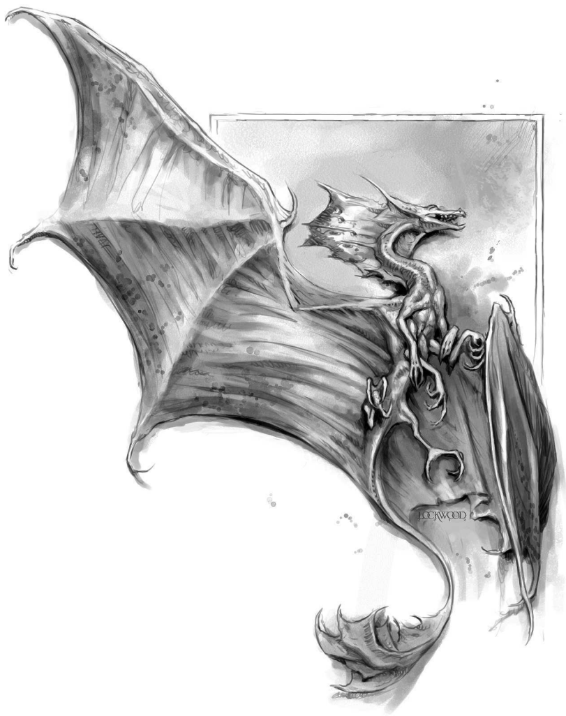
Искровичок (в натуральную величину)