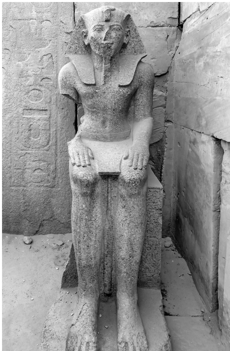
Сидячая статуя Тутмоса III. Храмовый комплекс в Карнаке. Луксор, Египет