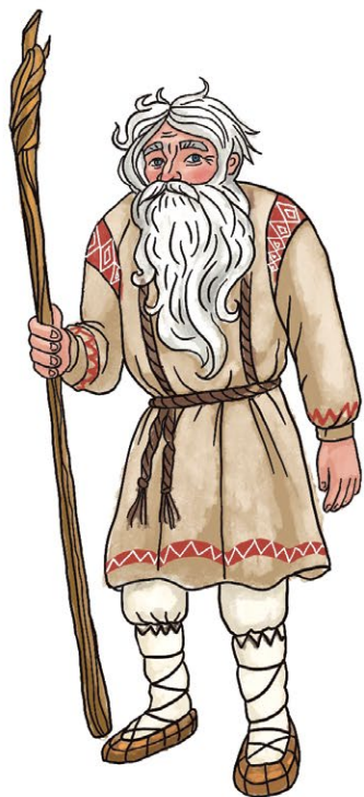
ТРЕСКУНЕЦ, ИЛИ СТУДЕНЕЦ