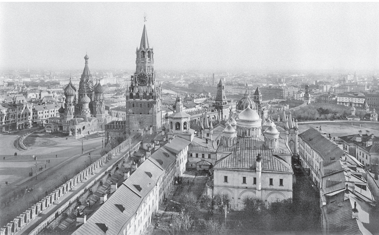
Вознесенский монастырь. Фото конца XIX века

Вдова Дмитрия великая княгиня Евдокия создала новый княгинин некрополь в кремлевском Вознесенском монастыре. Именно Евдокия, в монашестве Евфросиния, — первая видимая женщина Москвы. По существу, она открывает женскую тему в столице. Открывает, что прекрасно, собственной святостью.