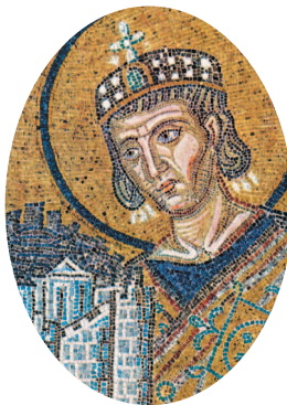
Константин Великий приносит Новый Рим в дар Богородице. Мозаика над входом в собор Святой Софии.