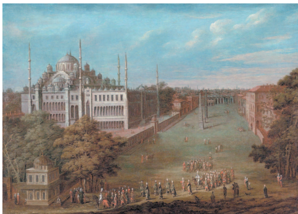
Великий визирь пересекает площадь Атмейданы. Ж.-Б. ван Мур, первая половина XVIII в.

За шесть лет город подняли практически из руин. Константин не жалел на его возведение ни средств, ни указов. В Византий прибывали лучшие мастера