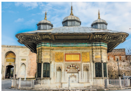
Фонтан Ахмеда III.