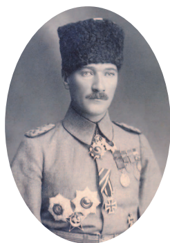
Мустафа Кемаль Ататюрк – первый президент Турецкой Республики, основатель современного турецкого государства.

Ситуация еще больше усугубилась после участия государства в Первой мировой войне, которое привело к оккупации страны силами Антанты. Но национально-патриотические силы во главе с Мустафой Кемалем восстали против иностранной интервенции и, изгнав непрошенных гостей, создали независимую Турецкую Республику. Новому государству нужна была новая столица. Мустафа Кемаль Ататюрк объявил таковой Анкару, а Константинополь в 1930 г. официально переименовали в Стамбул. Несмотря на потерю столичного статуса, город продолжает оставаться торгово-промышленным, коммерческим, культурным, а также туристическим центром страны.