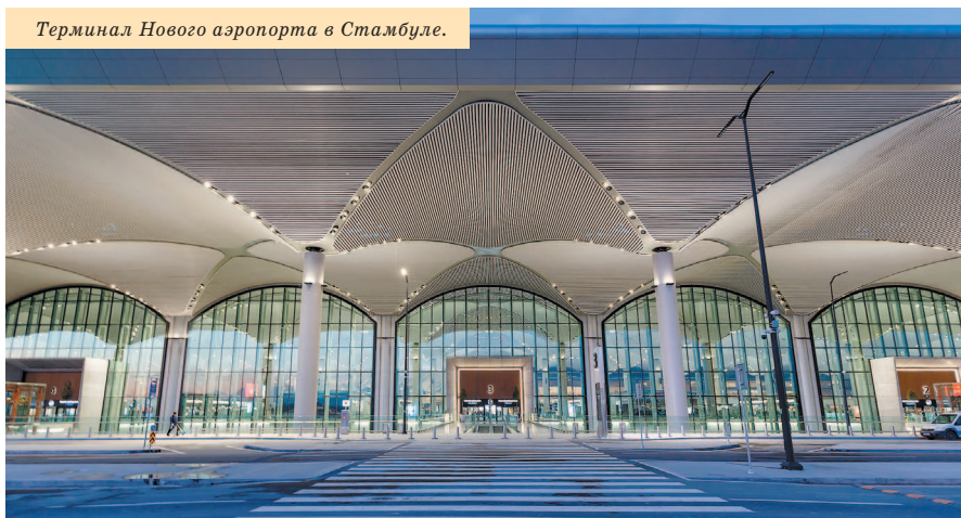
Терминал Нового аэропорта в Стамбуле.

Компактное расположение главных достопримечательностей Стамбула позволяет обойти их пешком. Но чтобы добраться до не менее привлекательных памятников истории и архитектуры, которые находятся в отдаленных от центра районах, предстоит освоить различные виды городского транспорта. Перемещать-