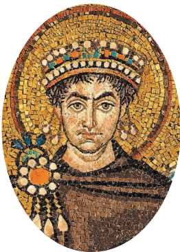
Юстиниан I. Мозаика в церкви Сан-Витале в Равенне, Италия.

Помимо руссов виды на Константинополь имели арабы. Но самое удивительное, что на оплот христианства в 1204 г.