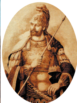
Константин XI Палеолог – последний правитель Византийской империи. Рисунок XIX в.