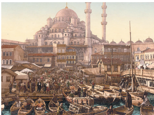
Базар на площади Эминеню и Новая мечеть. Фото 1890–1900 гг.