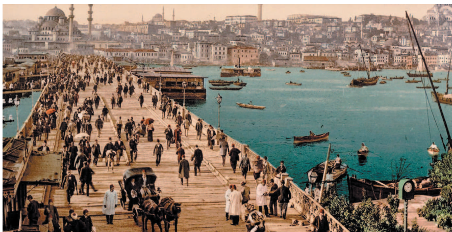
Галатский мост, фото конца XIX в.

посягнули сами христиане. Впервые в своей истории город пал под натиском крестоносцев. Результатом Четвертого крестового похода стало не только разграбление города. Вся Византия была поделена на несколько царств. Константинополь же вошел в созданную крестоносцами Латинскую империю, которая просуществовала всего 57 лет.