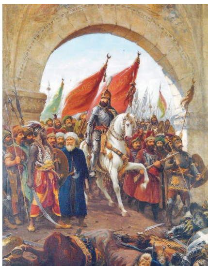
Фаусто Зонаро. Вступление Мехмеда II в Константинополь.

Тем временем на востоке все ближе к Византийской империи подби-