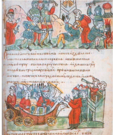
Поход Олега на Царьград. Миниатюра из Радзивилловской летописи. XV в.

Наибольшего расцвета Византия достигла в VI в. во времена правления Юстиниана. При нем в столице были