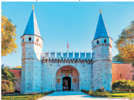
Вход во дворец Топкапы охраняют две башни

Попасть во дворец можно, пройдя через 2 парк Гюльхане. Gulkhāna в переводе с персидского означает «дом роз». Такое название парк получил не случайно: изначально он представлял собой розарий дворца Топкапы. В конце парка высится 3 Готская триумфальная колонна, воздвигнутая еще в III в. в честь победы римских императоров над готами, о чем свидетельствует надпись: «С победой над готами фортуна вновь повернулась к нам». Это древнейший памятник римской архитектуры в городе, дошедший до наших дней. Главная аллея парка ведет на севере к смотровой площадке, откуда открывается великолепный вид на оживленное пространство бухты Золотой Рог, навстречу Босфору. В западной оконечности парка в бывших конюшнях дворца расположился Стамбульский исторический музей исламской науки и техники, открытый в 2008 г. турецким премьер-министром Эрдоганом.