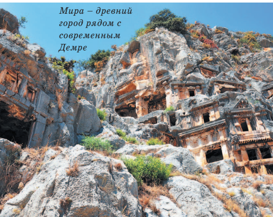
Мира – древний город рядом с современным Демре

Но наибольшее значение для Анатолии имел захват территории турками-османами, правители которых основали здесь ве-