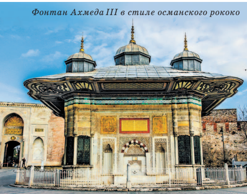
Фонтан Ахмеда III в стиле османского рококо

и большой черный крест, выполненный в технике мозаики на золотистом фоне, и так называемый синтрон (пять рядов сидений, охватывающих апсиду, где во время службы располагалось духовенство). В наши дни помещение церкви используется для проведения концертов.