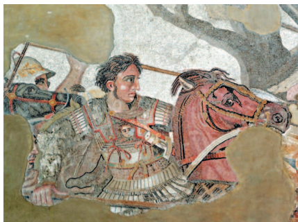
Фрагмент древнеримской мозаики из Помпеи. Александр Македонский (Александр III Великий; 356 г. до н.э. – 323 г. до н.э.) – выдающийся полководец, создатель мировой державы, распавшейся после его смерти