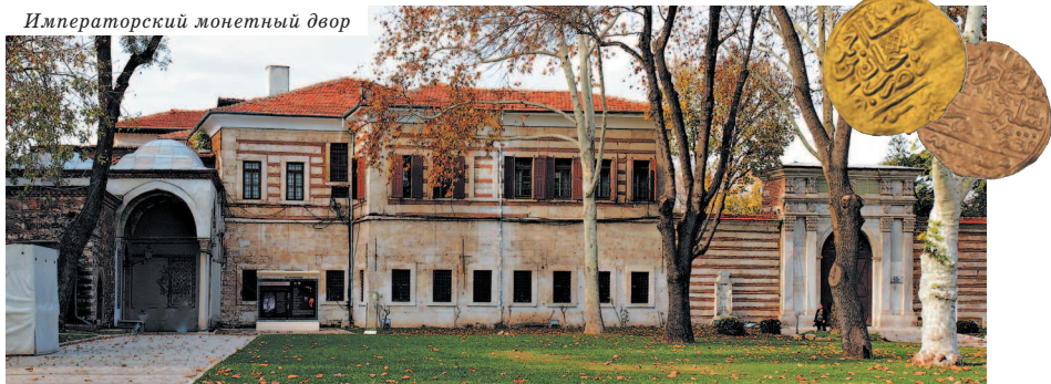
Императорский монетный двор

Нынешнее здание храма Св. Ирины датируется VI в., но ученые выяснили, что ему предшествовало как минимум три строения. Первая христианская базилика была возведена на этом месте на руинах древнего храма Афродиты при римском императоре Константине в IV в. Примечательно, что церковь на протяжении всей своей истории никогда не превращалась в мечеть, поэтому в ней сохранились и атриум (просторное высокое помещение при входе в церковь),