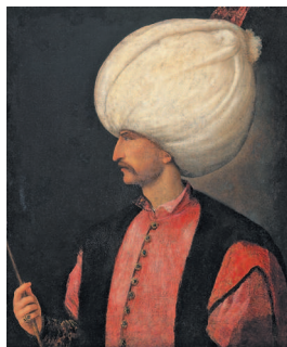
Портрет Сулеймана I Великолепного (Кануни; 1494–1566) – десятый султан Османской империи, и 89-й халиф