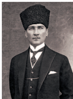
Мустафа Кемаль Ата-турк; Гази Мустафа Кемаль-паша; (1881–1938) – основатель современного турецкого государства

Рим тоже не заставил себя долго ждать. Уже во II в. до н.э. войска Римской республики отправились на завоевания восточных земель. По мере своего продвижения римская цивилизация насаждала свои представления об архитектуре, гигиене, дорогах и праве. Сегодня мы можем наблюдать многие из сохранившихся архитектурных памятников того периода по всей Турции.