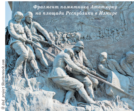
Фрагмент памятника Ата-турку на площади Республики в Измире