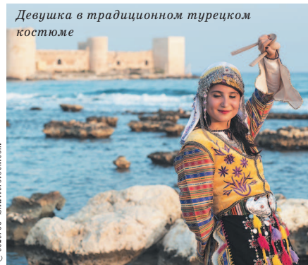
Девушка в традиционном турецком костюме

Турки будут приятно удивлены, если вы употребите всего пару слов на турецком. Например, «Мераба» значит «Здравствуйте». В неформальной обстановке можно использовать «Селям», что переводится как «Привет». Уходя, скажите «Ийи гюнлер», что означает «Всего хорошего». «Спасибо» звучит как «Тешеккюр эдерим», а «Пожалуйста» – «Лютфен».