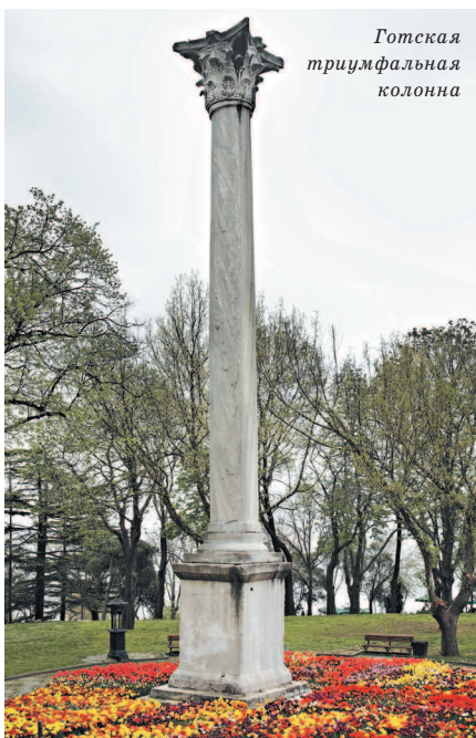
Готская триумфальная колонна