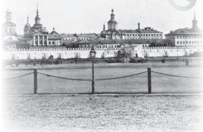
Китай-город. Вид с Театральной площади

Против Проломных ворот десятки ломовиков то сидели идолами на своих полках, то вдруг, будто по команде, бросались и окружали какого-нибудь нанимателя, явившегося за подводой. Кричали, ругались. Наконец по общему соглашению устанавливалась цена, хотя нанимали одного извозчика и в один конец. Но для нанимателя дело еще не было кончено, и он не мог взять возчика, который брал подходящую цену. Все ломовые собирались в круг, и в чью-нибудь шапку каждый бросал медную копейку, как-нибудь меченную. Наниматель вынимал на чье-то «счастье» монету и с обладателем ее уезжал.