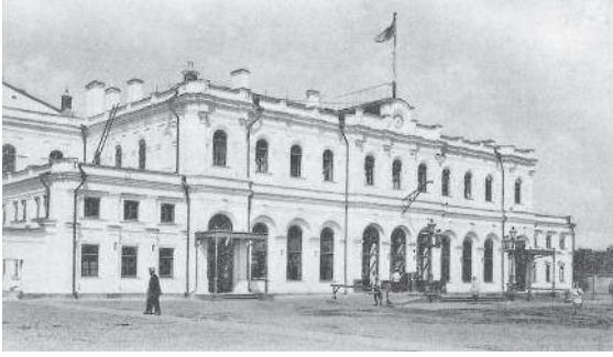
Ярославский вокзал. 1903 г. Издание фирмы «Шерер, Набоглиц и К°». (На месте этого здания было построено новое ныне существующее здание)

Миновали вокзалы, переползли через сугроб и опять зашагали посредине узких переулков вдоль заборов, разделенных деревянными домишками и запертыми наглухо воротами. Маленькие окна отсвечивали кое-где желто-красным пятнышком лампадки... Темь, тишина, сон беспробудный.