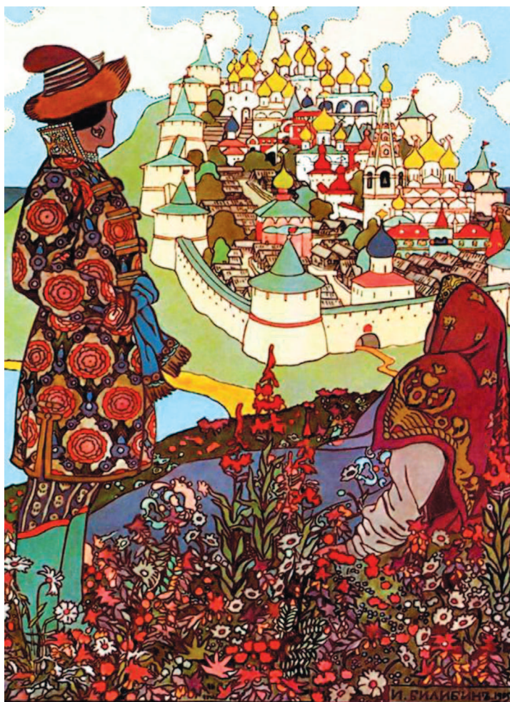
«На наш взгляд современного человека, это был огромный музей сокровищ». И. Билибин, иллюстрация к «Сказке о царе Салтане», 1905

Выше Теремка были только купола кремлевских соборов. А сейчас скрытый поздними зданиями Теремной дворец можно увидеть только с самых ближних ракурсов в самом Кремле и с двух-трех случайных точек вне его. Не говоря о том, что интерьеры легендарного памятника, находящегося на закрытой территории, для подавляющего большинства москвичей и гостей столицы по-прежнему существуют лишь на картинках.