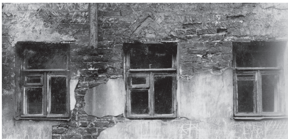
Наличник XVII в., скрывающийся под поздней штукатуркой Братского корпуса на Варварке. Фото начала 1960-х