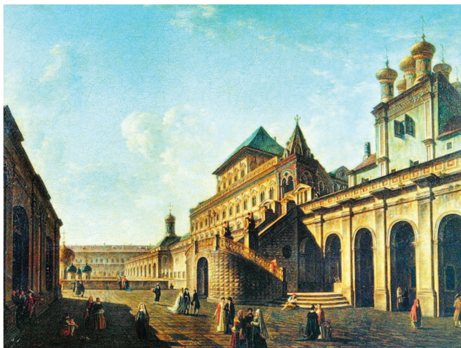
Вид на Терема с не существующей ныне Боярской площадки Государева двора. Картина Ф. Алексеева, 1801

каменным здесь становится не только подавляющее большинство жилых домов, но и отдельные надворные постройки.