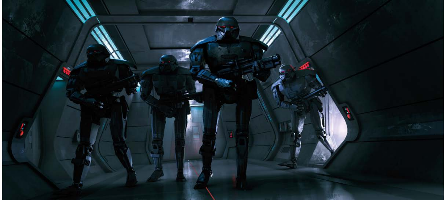
✦ ВТОРЖЕНИЕ НА МОСТИК. ВАРИАНТ 277 Чёрч