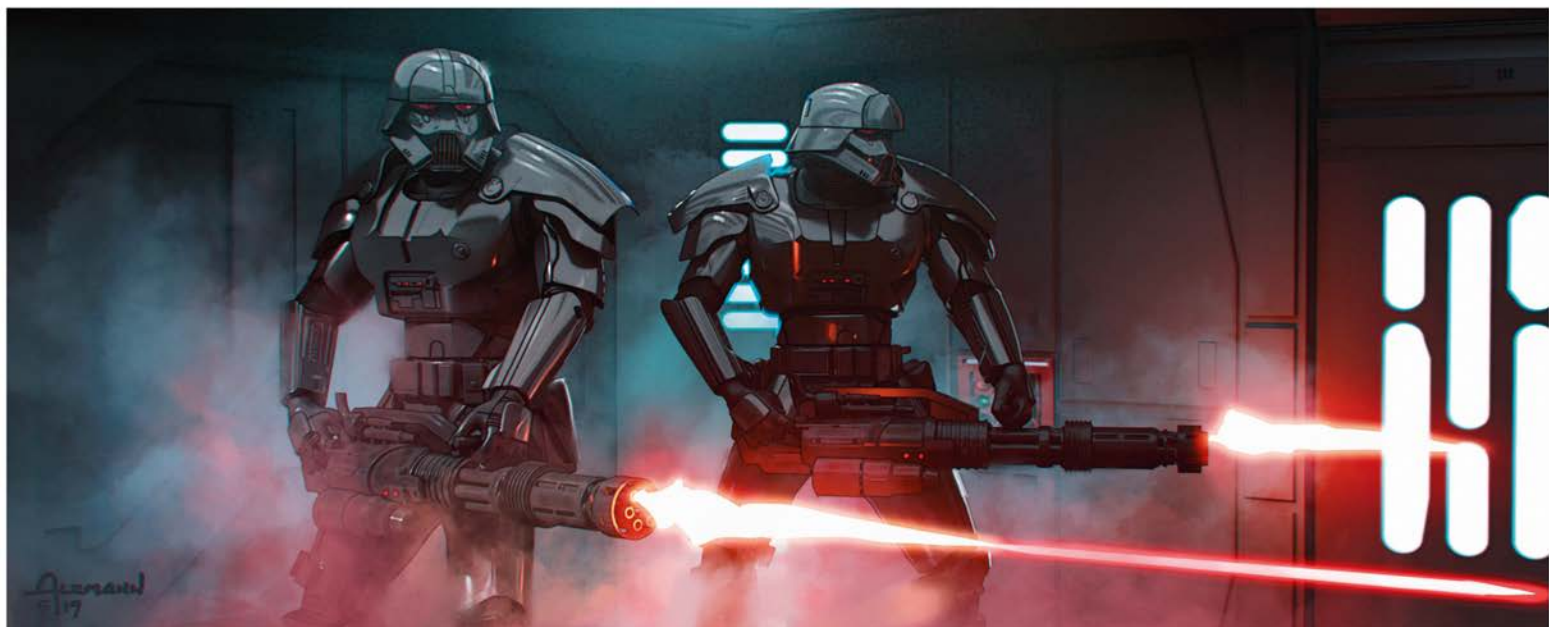
✦ ТЁМНЫЙ ШТУРМОВИК. ВАРИАНТ 115 Альцманн