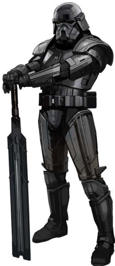
→ ТЁМНЫЙ ШТУРМОВИК. ВАРИАНТ 154 Матьяш

«У тёмных штурмовиков очень необычные механические пропорции. Поэтому труднее всего нам было перенести их в чисто кинематографическую плоскость». Чианг