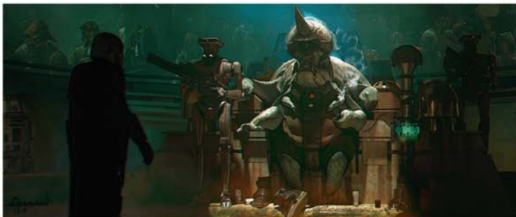
← ГОР КОРЕШ. ВАРИАНТ 03 Альцманн