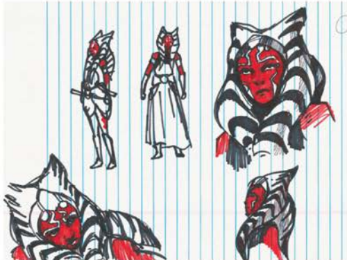
↑ ПОЗЫ АСОКИ. НАБРОСОК 01 Филони

← ЛЕСНАЯ АСОКА. ВАРИАНТ 01 «Вначале я пробовал всякие самурайские пластины, потому что её световые мечи сильно напоминают рукоятки катаны и танто. В её образе вообще много японского, чувствуется влияние Курошавы. Дайе очень хотел для неё костюм в светло-серых тонах». Матяш