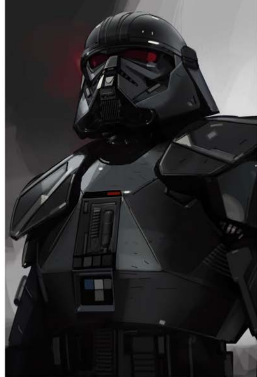
→ ПОРТРЕТ ТЁМНОГО ШТУРМОВИКА. ВАРИАНТ 158 Матьяш