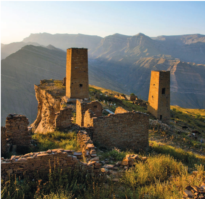
Руины и башни аула Гоор