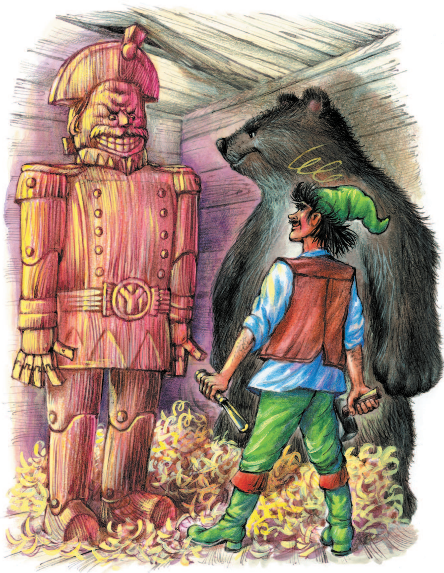
Рисунки И. Уваровой и А. Чукавина