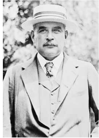
Джон Пирпонт Морган-младший* (1867–1943)

Ханаанский олигархат установил над США контроль таких масштабов, которые в мировой истории встречались лишь единожды — в Карфагене. Америкой правили 60 семейств — Морганов, Рокфеллеры, Дюпоны, Меллоны, Гарриманы, Варбурги