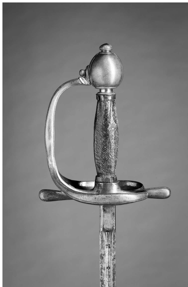
Кавалерийская офицерская шпага с оправой из позолоченной латуни, 1700 г. Из собрания Королевской сокровищницы, Стокгольм

В состав шведской армии входили Шведский, Померанский, Бремен-Верденский, Эстляндский и Лифляндский полки и эскадроны дворянского знамени, выставлявшиеся за счет богатых дворян провинций королевства. Шведский полк дворянского знамени состоял из 8 рот по 100 человек. Наиболее малочисленными были Померанский и Бремен-Верденский эскадроны дворянского знамени. Они насчитывали 160 и 147 человек соответственно 1 .