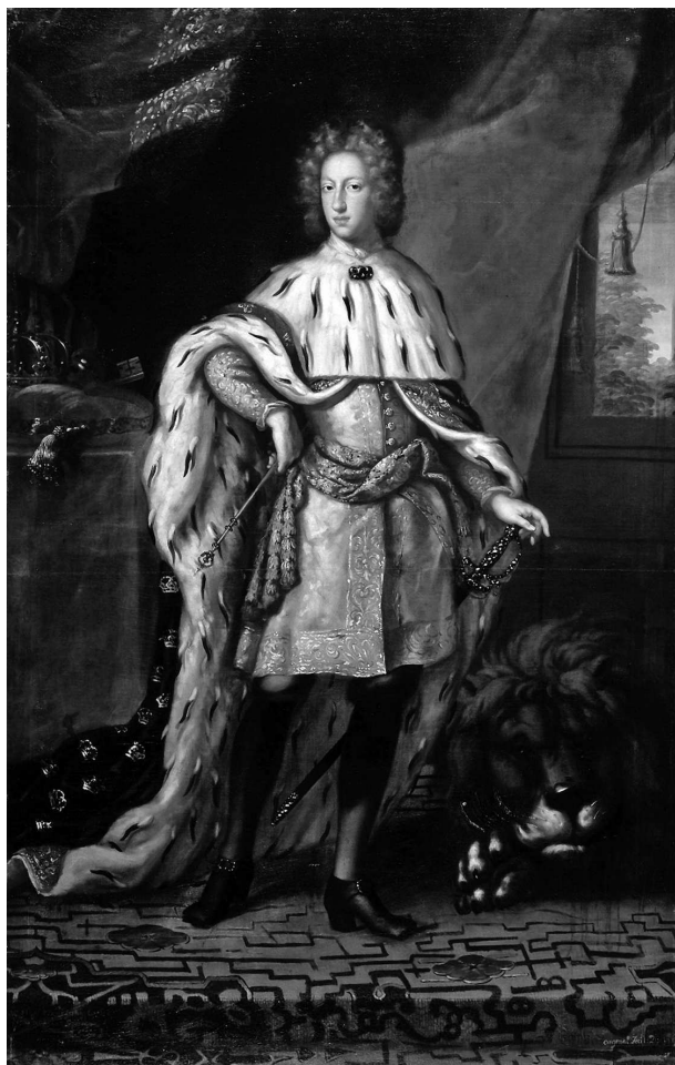
Король Швеции Карл XII в коронационном костюме в окружении символов королевской власти.

Король из-за большой протяженности театра боевых действий не мог лично оперативно влиять на ход событий. Поэтому в Финляндии, Ингерманландии, Эстляндии, Лифляндии и Курляндии все функции управления войсками были переданы командующим отдельными корпусами, что для того времени было новым и довольно смелым шагом. Король составлял только общий оперативный план действий, а частные начальники должны были самостоятельно его реализовывать в соответствии с местными условиями.