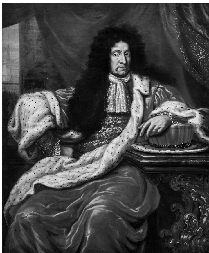
Генерал-фельдмаршал граф Эрик Йёнссон Дальберг (1625–1703), генерал-губернатор Ливонии, в мантии городского совета Риги. Портрет работы Давида Клёккер-Эренстрала

Вместе с тем шведский офицерский корпус не являлся замкнутой корпорацией, давая возможность продвигаться по службе представителям других сословий. Так, генерал-фельдмаршал граф Эрик Дальберг [18, Р. 8] родился в простой крестьянской семье, генерал-