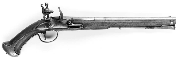
Шведский кремнёвый пистолет, 1714 г.

Крайне важным был вопрос регулярной выплаты жалованья личному составу армии. Оно выплачивалось в зависимости от занимаемой должности. При Карле XI в 1689 г. рядовой в год получал 9 риксдалеров, фурьер — 30 риксдалеров, фельдфебель и фанен-юнкер — 41 риксдалер, прапорщик — 50 риксдалеров, лейтенант — 100, а капитан — 200 риксдалеров соответственно. Самые большие оклады были у штаб-офицеров. Подполковник получал 750, а полковник 1500 риксдалеров [16. Р. 12–13]. Такая градация денежного содержания поднимала значимость службы под королевскими знаменами и стимулировала профессиональный рост солдат и офицеров шведской армии.