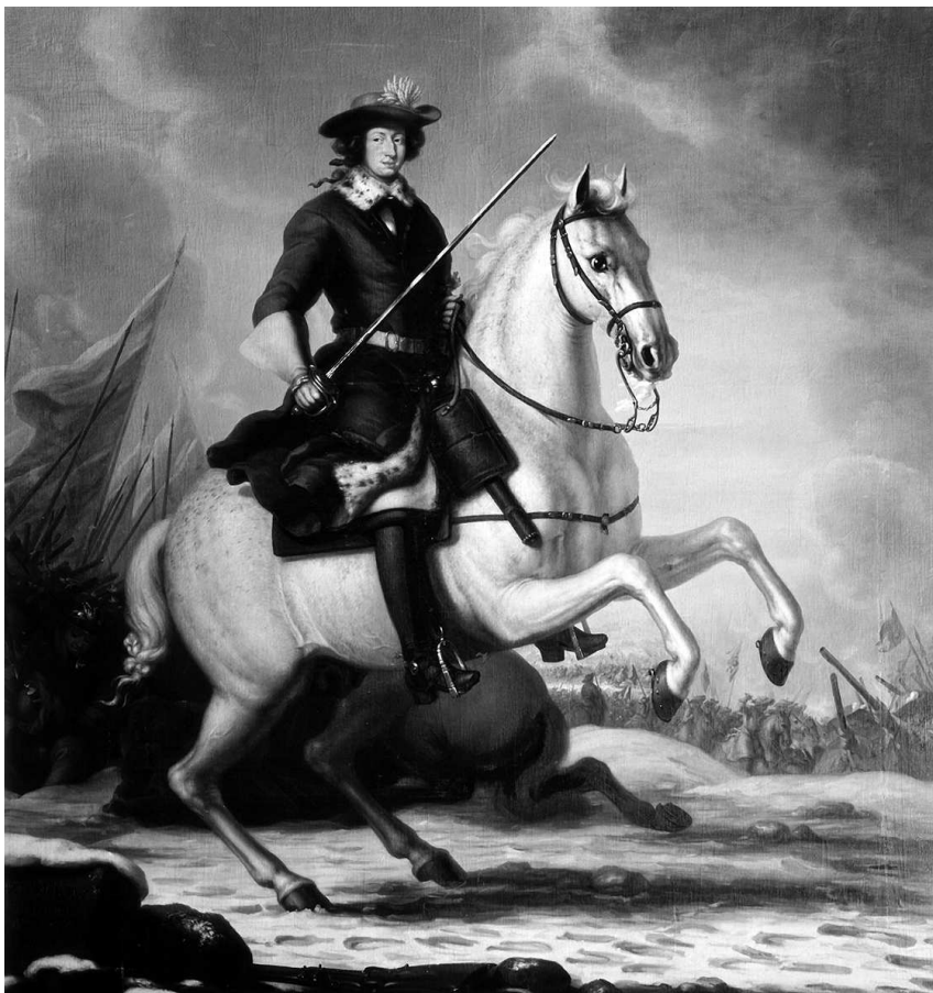
Карл XI. Король Швеции с 1660 по 1697 г. Картина Давида Клёккер-Эренстраля, 1676 г., из собрания замка Грисхольм

дарством 1 . Группа крестьянских дворов, обязанная выставлять и содержать одного солдата, называлась «ротехолл» (rotehåll), а составлявшие ее крестьяне — землевладельцы — «ротехолларами» (rotehållarna). Солдаты, содержавшиеся индельтами одного лена, сводились в полк, носивший его название (например,