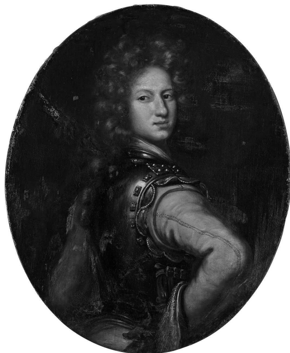
Пятнадцатилетний Карл XII в военной форме на портрете кисти Давида Клёккер-Эренстраля

Дальберг [18, Рр. 11–13], генералиссимус принц Фредрик фон Гесен-Кассельский обучался в Утрехтском университете (Нидерланды) [16, Рр. 29–31], а генерал-лейтенант барон Ханс Исаак Риддеръельм учился в Страсбурге (Франция).