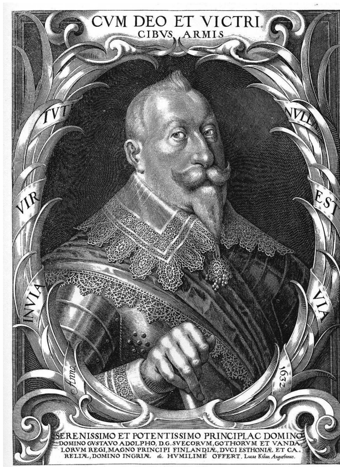
Король Швеции с 1611 по 1632 г. Густав II Адольф. Портрет, выгравированный Лукасом Килианом, около 1632 г.

мени, но война питает войну. Армия содержалась и даже пополнялась из областей, которые она покоряла.