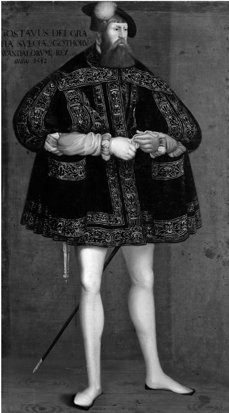
Густав Ваза, король Швеции с 1523 по 1560 г. Картина XVII в., основанная на портрете короля, выполненного в 1542 г.