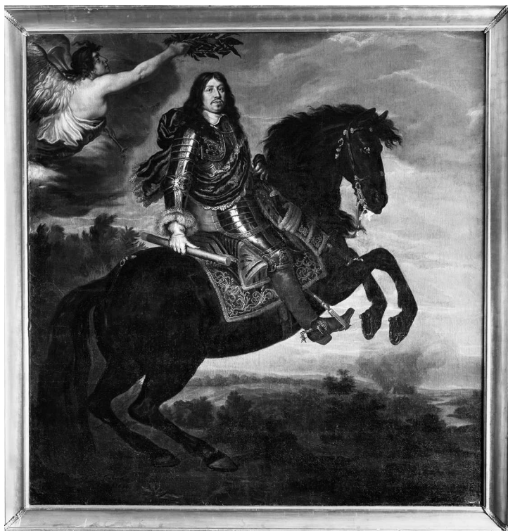
Конный портрет короля Швеции Карла X Густава в доспехах. Иоахим фон Сандрарт, 1650 г. Из собрания замка Скокlostер

Оскорбление офицера влекло отсечение руки, а в случае его гибели — повешение. Дуэль между офицерами влекла за собой смертную казнь не только для ее участников, но и для секундантов 1 .