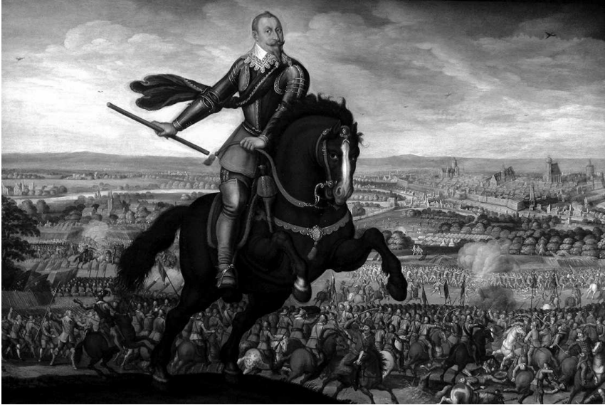
Шведский король Густав II Адольф на поле сражения при Брейтенфельде в 1631 г. Картина Иоганна Якоба Вальтера, 1632 г., из собрания Музея изобразительного искусства Страсбурга

Во многом, данный артикул базировался на римском праве, с дополнениями из нидерландского и германского права 1 .