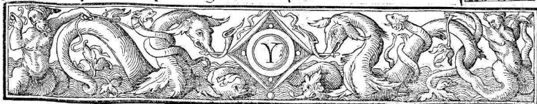
Сборник инструкций канцелярии Святой Инквизиции, составленный Томасом де Торквемада. Гранада, 1537 г.

delas Instruções del Officio dela sancta Inquisición hechas por el muy Reuerendo señor fray Thomas de Torquemada Prior del monasterio de sancta cruz de Segouia primero Inquisidor general delos reynos y señorios de España: E por los otros Reuerendissimos señores Inquisidores generales q̄ despues succedieron / cerca dela orden que se ha de tener enel exercicio del sancto officio donde van puestas successiuamente por su parte todas las instruções q̄ tocan a los Inquisidores. E a otra parte las q̄ tocã a cada vno delos officiales y ministros del sancto Officio: las quales se copilarõ enla manera q̄ dicha es por mãdado del Illustrissimo y Reuerendissimo señor dō Alõso manri que Cardenal delos doze apóstoles Arçobispo de Seuilla Inquisidor general de España.