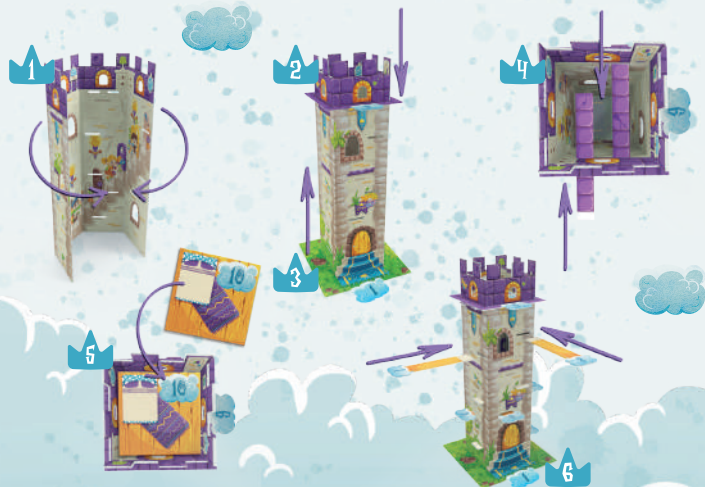
СХЕМА СБОРКИ БАШНИ