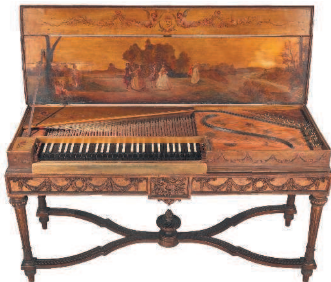
△ Клавикорд, 1763 г., Метрополитен-музей, Нью-Йорк

Этот инструмент имел сходство с современным фортепиано, но вместо молоточков, как у пианино или рояля, внутри клавикорда были установлены металлические пластинки — тангенты. Музыкант нажимал клавишу, а связанный с ней тангент ударял по струне. Клавикорд обладал красивым, но очень тихим звуком, что не давало