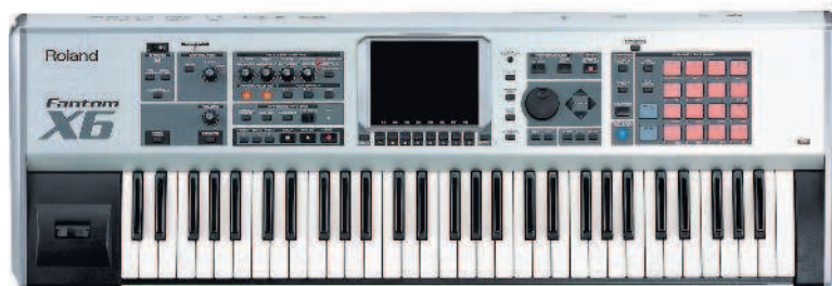
△ Roland Fantom-X6

Появление такого типа музыкальных инструментов с огромными возможностями для исполнителей открывает принципиально новые перспективы для развития электронной музыки и других направлений мультимедиаискусства.