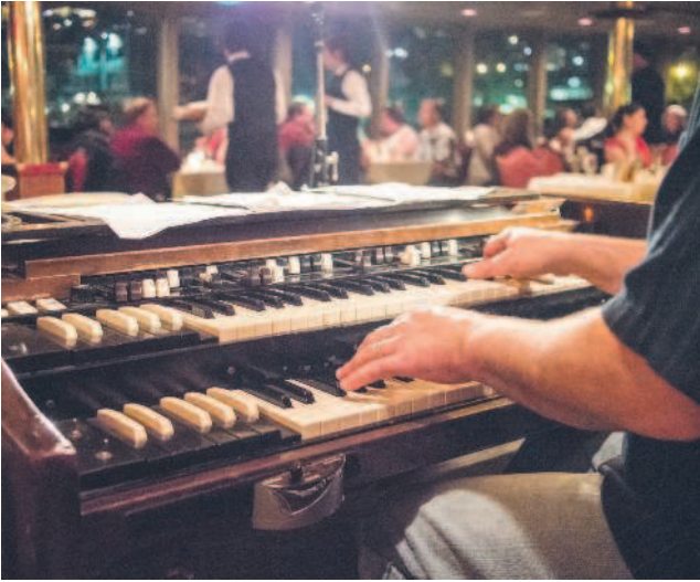
△ Орган Хаммонда

Основой нового инструмента был ряд металлических дисков с нанесенными по периметру зубцами-выступами. Эти диски, известные как колесики тонов, кружили по магнитному полю и создавали напряжение, порождающее звуковую волну.