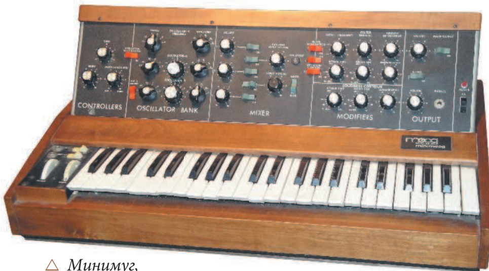
△ Минимуг, Музей наук Буффало, США

В 1970 г. Муг разработал упрощенную и облегченную версию своего творения, чтобы сделать его доступным для большинства музыкантов. Синтезатор получил название минимуг . Новый инструмент стал компактным, с интуитивным управлением. Больше не было никаких свисающих проводов, при этом все самое важное от его предшественника — модульного синтезатора — было сохранено. Изменения повлияли и на цену синтезатора, теперь он стоил около 1500 долларов вместо десятков и даже сотен тысяч за модульную систему.