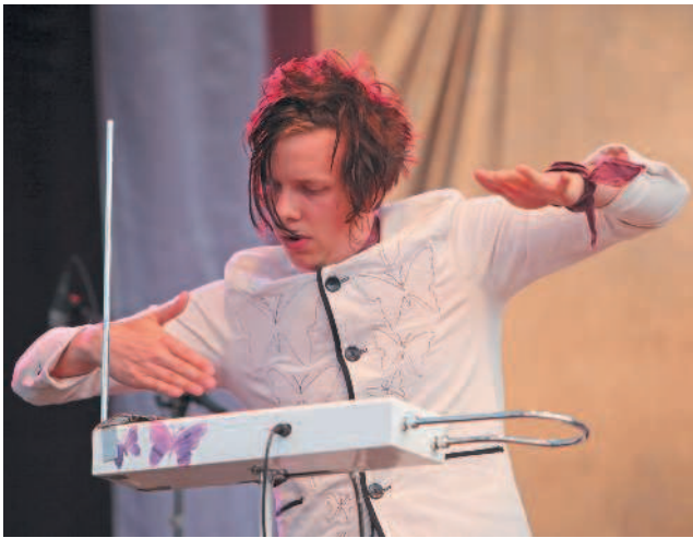
△ Музыкант из группы Detektivbyrån играет на современном терменвоксе

Этот инструмент представлял собой большой деревянный ящик с двумя антеннами. Звук создавался генератором, а громкость и высота зависели от близости руки к усилку антенны. Во время игры музыкант полагается только на свой слух и не касается инструмента. Терменвокс используют как для исполнения музыкальных произведений от классики до современных, так и для создания звуковых эффектов (пения птиц, завывания привидений и других).