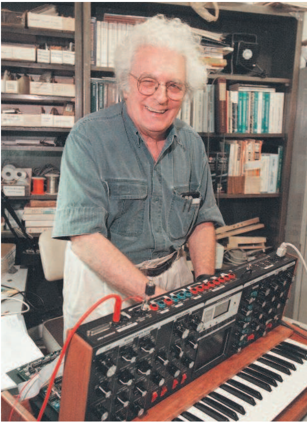
△ Роберт Муг

из генератора, фильтров и электроламповых усилителей. По этой причине первые синтезаторы были сложным оборудованием с огромными панелями, витками проводов и запутанными руководствами. Цены на