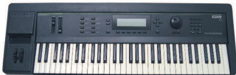
△ Kurzweil K-2000

Современные музыкальные рабочие станции , объединяющие компьютер, цифровой синтезатор, секвенсор, семплер и другие устройства, представляют собой новый класс музыкальных инстру-