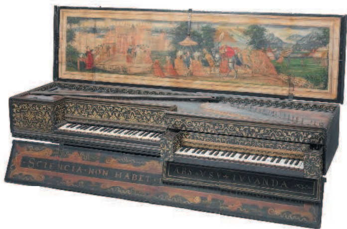
△ Клавикорд, 1600 г., Метрополитен-музей, Нью-Йорк

возможности играть на нем в больших залах. Причина была в его устройстве: клавикорд имел всего по одной струне на клавишу, у фортепиано же на каждую клавишу приходится до трех струн.