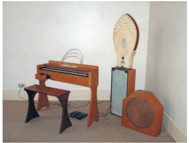
△ Волны Мартено

Композитор Эдгар Варез для своего произведения «Ecuatorial» собирался задействовать два терменвокса, однако в концертной практике контролировать их оказалось