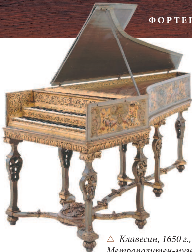
△ Клавесин, 1650 г., Метрополитен-музей, Нью-Йорк