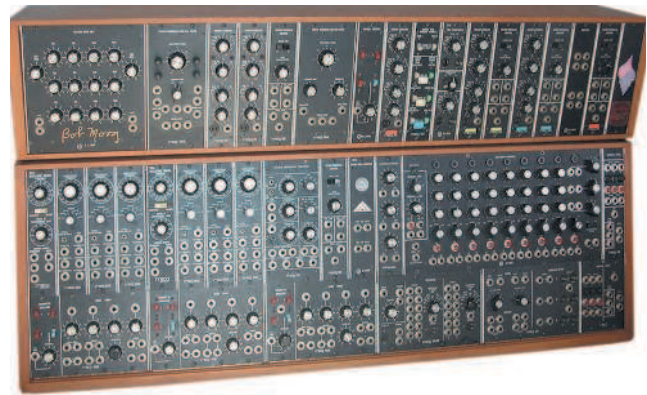
△ Moog Modular 55

из генератора, фильтров и электроламповых усилителей. По этой причине первые синтезаторы были сложным оборудованием с огромными панелями, витками проводов и запутанными руководствами. Цены на