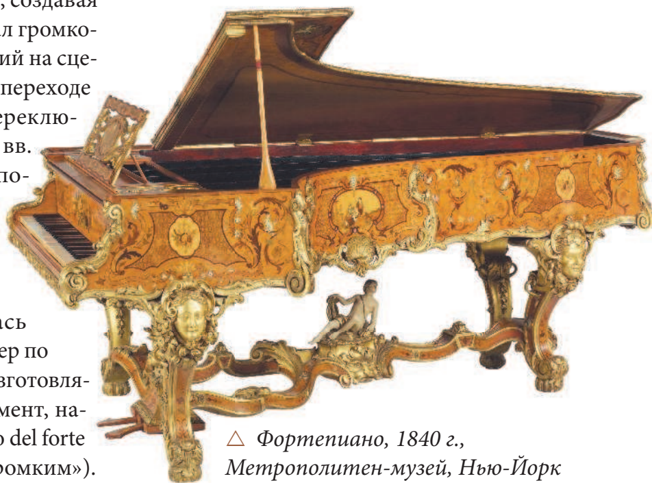
△ Фортепиано, 1840 г., Метрополитен-музей, Нью-Йорк

Бартоломео Кристофори не оценил важность своего, по сути, исторического изобретения, и интерес к новому инструменту вскоре угас. О фортепиано забыли на долгие годы, и лишь в 1729 г. немецкий мастер Готфрид Зильберман узнал о работе Кристофори и на его основе создал собственный образец. К 1750 г. этот инструмент получил одобрение самого Иоганна Себастьяна Баха.