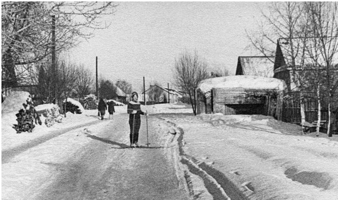
Дот на наб. Кирова в п. Селижарово Калининской области.

Rshew», — называл 42 пехотные, танковые, СС, авиационные дивизии. Современный немецкий историк К. Затлер, включая соединения 4-й пехотной и 4-й танковой армий, фиксирует уже 57 пехотных, моторизованных, танковых, СС, авиационных дивизий, которые с января 1942 г. по март 1943 г. действовали в районе «Brückenkopf Rshew» (ржевского плацдарма).