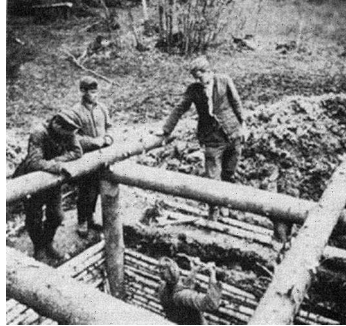
Строительство бункера на участке 18-го пехотного полка 6-й пехотной дивизии. Лето 1942 г.

рошо укреплены берега рек Касни и Вазузы. Многочисленные дзоты были соединены густой сетью траншей.