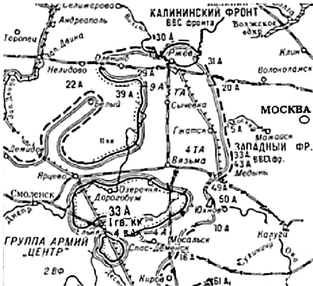
Схема 1. Ржевско-виземский выступ в линии советско-германского фронта.

В конце января 1942 г. в результате наступления советских войск линия фронта на центральном участке советско-германского фронта была очень извилистой и образовывала выступы то в глубину немецкой обороны, то в линию фронта советских войск. Так, войска советских 3-й и 4-й ударных армий продвинулись до Холма, Демидова и Велижа, а войска немецкой группы армий «Центр» глубоко вклинились в расположение советских частей в районах Белого, Ржева. Линия фронта проходила здесь западнее Белого, севернее Оленино, севернее и восточнее Ржева, восточнее Зубцова, Гжатска, до марта 1942 г. восточнее, а затем западнее Юхнова (схема 1 1 ).