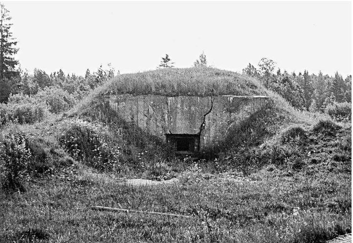
Дот в Оленинском районе Калининской области. 1980-е гг.