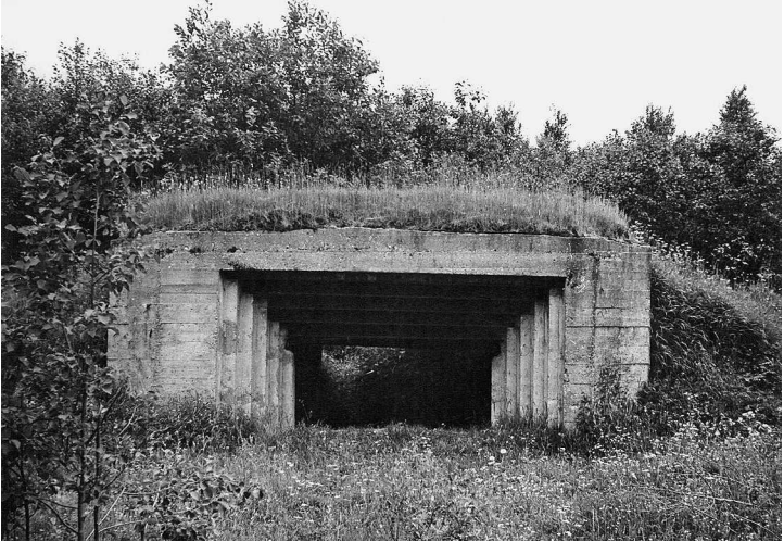
Дот в Оленинском районе Калининской области. 1980-е гг.