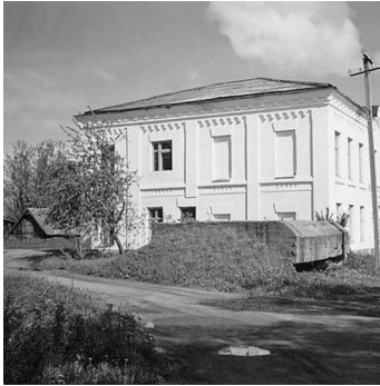
Дот на ул. Новой в п. Селижарово Калининской области.

районе выступа, до трети всех сил, находившихся на Восточном фронте (таблица 1).