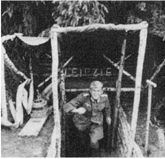
Вход в бункер на участке 18-го пехотного полка 6-й пехотной дивизии. Лето 1942 г.