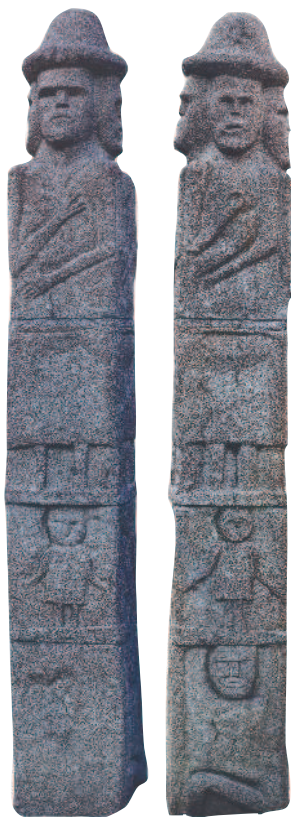
Копия Збручского идола X в.

Религиозная реформа Если верить легендам, в Киеве при Ярополке христианам жилось вольготнее — князь даже разрешил построить близ теремного двора каменную церковь.