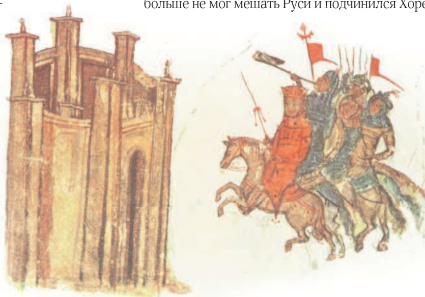
Завоевание Святославом Болгарии. Миниатюра из Хроники Константина Манассии. XII в.

В 962 г. Ольга передала своему сыну власть в полном объеме, и военные походы, о которых Святослав грезил с отрочества, начались. Через два года князь освободил от хазарского влияния вятичей — последнее угнетенное славянское племя, а еще через год подготовил военный поход против хазар, занимавших земли между Аральским и Чёрным морями. В 965 г. Святослав с мощной армией напал на один из главных городов хазар — Саркел. В том же году отправился к столицам Хазарского каганата — городам Итилю и Семендеру. Между двумя упомянутыми битвами князь захватил еще один крупный вражеский город — Самкерц. Хазарский каганат, хотя и не был уничтожен, оказался ослаблен настолько, что больше не мог мешать Руси и подчинился Хорезму.