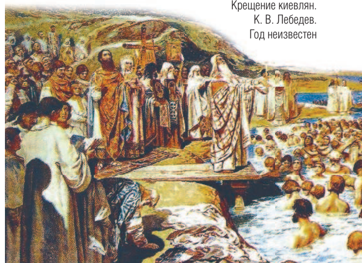
Крещение киевлян. К. В. Лебедев. Год неизвестен

По одной версии, великий князь устал от бесконечных войн, по другой — полюбил византийскую принцессу Анну (она была христианкой и не согласилась бы выйти замуж за язычника). Самым правдоподобным объяснением соседние державы: на востоке находились болгары-мусульмане, на юго-востоке — хазары-иудеи, на западе — римские католики, на юге — православные византийцы. Это были весьма влиятельные государства в Европе, и от того, какую религию примет Русь, зависело благополучие ее внешней политики. Греческая вера была ближе русскому народу: простым жителям и даже правителям либо нравилось православие, либо они уже крестились, к тому же Русь и Византию издавна связывали тесные взаимоотношения.