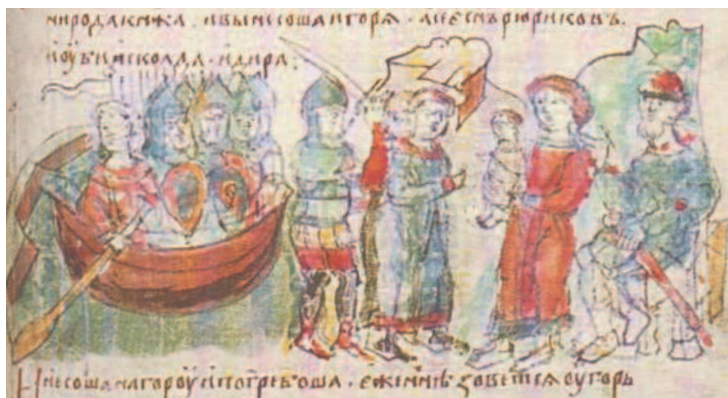
Олег показывает Аскольду и Диру юного Игоря. Миниатюра из Радзивилловской летописи. XV в.

Какое-то время существовало две Руси: Новгородская под началом Рюрика и Киевская, которой правили Аскольд и Дир. Освободив Киев от хазарской дани, они подчинили полянские земли. После столкновения с византийцами Аскольд, Дир и часть