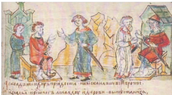
Дань полян хазарам. Миниатюра из Радзивилловской летописи. XV в.

Покорение хазар Начиная с VII в. некогда всего лишь кочевое племя хазар превратилось в ощутимую угрозу для многих народов. Мирный исход был невозможен.