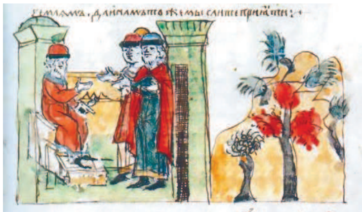
Владимир беседует с православными послами. Миниатюра из Радзивилловской летописи. XV в.

Вероятно, князь сам пригласил их, чтобы выбрать веру, которая больше понравится ему и народу. Первым из соседней Болгарии пришел представитель магометан. Владимиру понравилось многоженство, однако обрезание, запрет на свинину и вино были не по душе. Следующим явился посол из католического Рима. Его князь отправил домой, заметив: раз отцы не захотели принять эту веру, значит, и мы не будем. Третьим стал хазарский проповедник иудейской веры. Она не понравилась князю: Владимир считал, что евреи, которых Бог оставил без дома, желают его стране того же. Последним пришел христианин из Византии. Речи грека понравились князю. Посланец показал Владимиру изображение Страшного