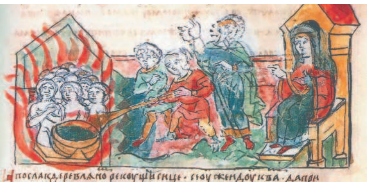
Вторая месть Ольги древлянам. Миниатюра из Радзивилловской летописи. XV в.

Никто из правителей Руси долго не мог покорить древлян. Князь Игорь, казалось, подчинил их и обложил данью, но поплатился за это жизнью. Жестокая расправа над мужем, безусловно, заставила Ольгу негодовать. Последней каплей стало предложение в 945 г. замужества от древлянского князя Мала. Едва ли не сразу после убийства Игоря он прислал к Ольге сватов. Властительница не стерпела этого и под видом гостеприимной хозяйки приказала киевлянам поднять древлянскую ладью на руки и принести ее к теремному дворцу. Затем вдова послала в Искоростень, столицу древлян, гонцов, которые мчались быстрее вести о случившемся за новыми сватами. Князь на радостях отправил в Киев знать. Княгиня же пригласила древлян в баню, утверждая, что таков обычай русов, а потом велела сжечь их там живьем.