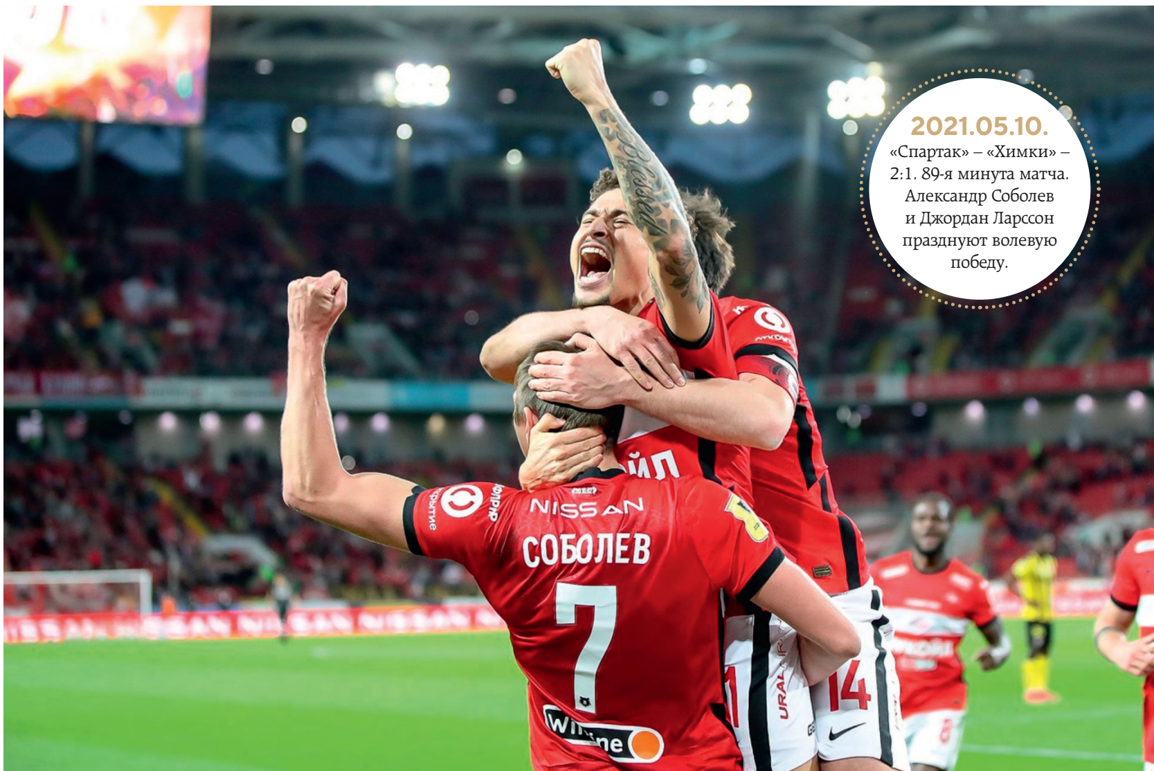
2021.05.10. «Спартак» – «Химки» – 2:1. 89-я минута матча. Александр Соболев и Джордан Ларссон празднуют волевую победу.