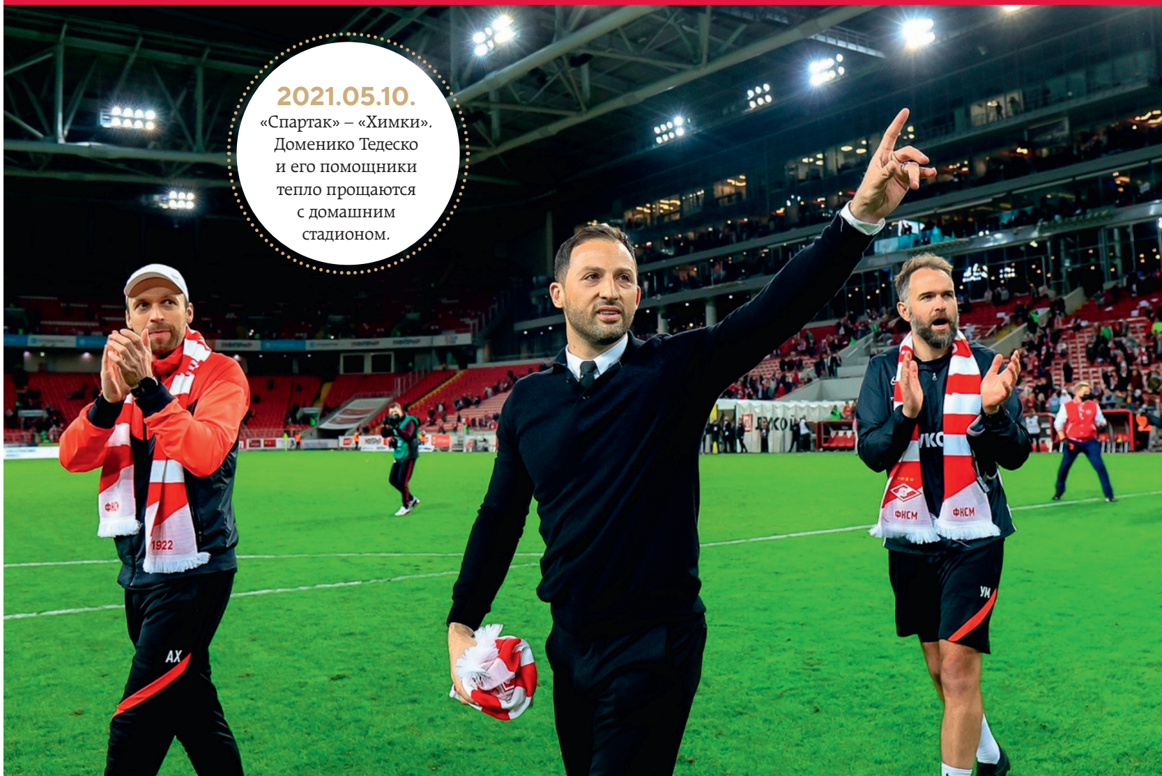
2021.05.10. «Спартак» – «Химки». Доменико Тедеско и его помощники тепло прощаются с домашним стадионом.